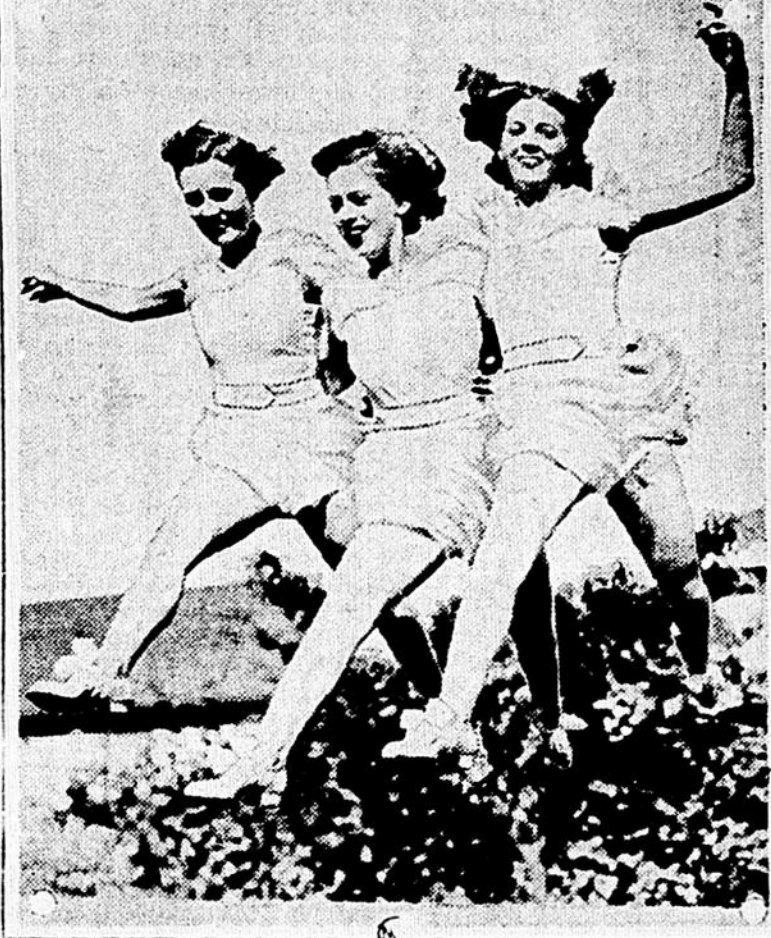
Trois nymphes américaines, en voyant nos satyres "houdistes" sur leur plage (voyage payé par cette bonne Concordia à un groupe d'échevins), à leur aspect libidineux s'enfuirent de leurs plus belles jambes.