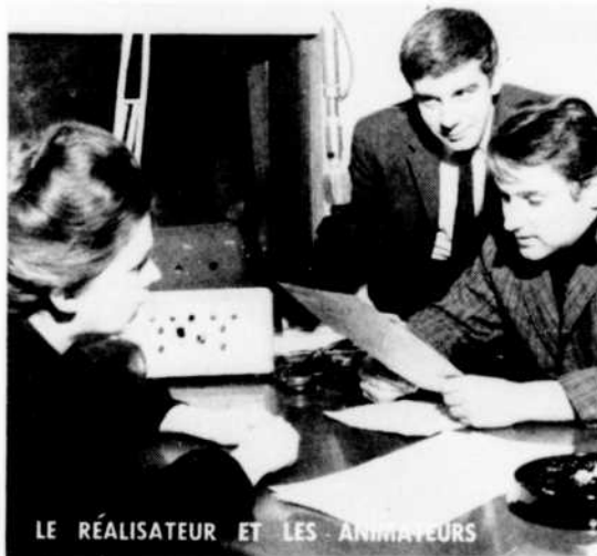
LE RÉALISATEUR ET LES ANIMATEURS

Les auditeurs du réseau français de Radio-Canada pourront apprécier à leur juste valeur la spontanéité des enfants en écoutant ces deux émissions originales de la série En sortant de l'école , les samedis 15 et 22 décembre à 9 heures du matin.