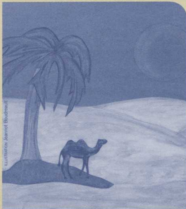
ILLUSTRATION JEANNOT BOUDREAU