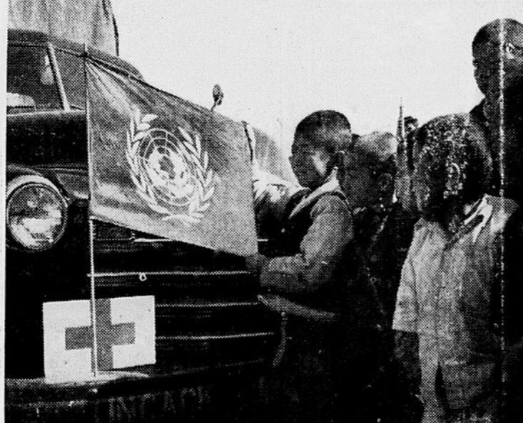
Pour écarter les dangers d'épidémies et protéger la population civile de Corée contre la maladie, la Section d'assistance civile du Commandement des Nations Unies en Corée a organisé des unités sanitaires mobiles qui desservent les villages isolés et leur apportent des secours médicaux. Ci-dessus, des enfants admirent le drapeau de l'ONU qui orne un camion automobile de l'assistance civile, en opération dans la province de Chung Chong Nam Do (Taejon).