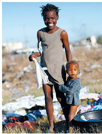
Camp de réfugiés à l'extérieur de Port-au-Prince

Notant que, par le passé, Haïti a fait l'objet de maints programmes et de mesures d'aide de toutes sortes, M. Papoulidis estime que ce qui fait l'originalité de la commission — et est donc un gage que cette fois-ci l'aide portera fruit — est que celle-ci rassemble autour d'une même table les représentants de la communauté internationale et ceux de la société civile et du gouvernement haïtiens. « Nous estimons que, de la sorte, la commission devrait réellement faire une différence, dit-il, puisque jamais un tel rassemblement de forces n'a été organisé en faveur d'Haïti. »