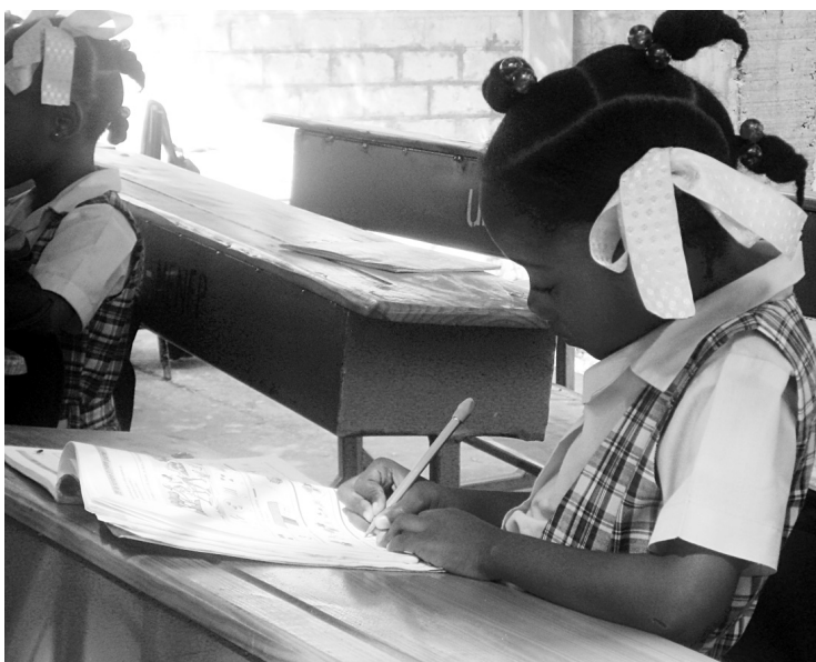
L'une des actions fondamentales de Développement et paix a porté sur l'aide consacrée à l'éducation et à l'école, pour que les enfants puissent terminer leur année scolaire.

Au cours des six premiers mois, Développement et paix a aidé à la mise en place de programmes de soins de santé pour 400 000 personnes et d'abris d'urgence ou de maisons temporaires pour 160 000 personnes, à la distribution de nourriture pour 1,5 million de personnes, ainsi que d'eau, de latrines et de nécessaires de toilette pour 280 000 personnes. Pour encourager la relance, l'organisme a aidé 40 000 personnes par l'entremise du programme « Argent contre travail », dans lequel des travailleurs, essentiellement des femmes, sont embauchés pour des projets, ce qui leur permet d'apprendre tout en étant rémunérés.