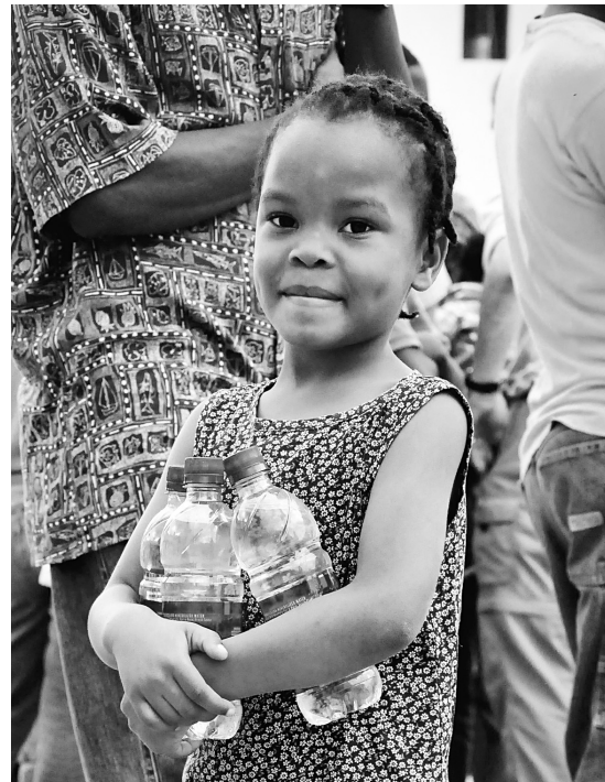
Vision mondiale internationale a amassé 194 millions pour venir en aide à Haïti

Pour le moyen et long terme, cette fois, l'organisation a projeté trois axes d'intervention. D'abord, comme il est jugé essentiel, l'axe de l'eau et de l'assainissement demeure. «Aussi, on veut renforcer les