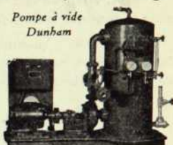
Pompe à vide Dunham

Téléphones : bur. : 2-4256 — rés. : 5277