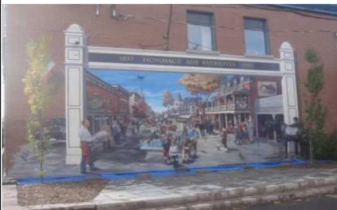
Hommage aux Patriotes Tribute to the Patriots

This walking tour, lasting 90 minutes, lets you relive step by step, the course of the battle of December 14, 1837. Accompanied by a guide, browse through the streets of Old Saint-Eustache learn more about the main characters as well as the various places associated with the events of December 1837. This visit also provides insight into the events and causes that led to the 1837 unrest.