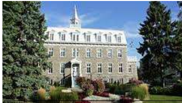
Hotel de Ville - City Hall

Le Vieux-Saint-Eustache, site du village établi à la fin du 18 e siècle, a été le théâtre de l'un des épisodes marquants de la Rébellion de 1837. Il est aujourd'hui un centre historique animé en toutes saisons avec son exceptionnel patrimoine bâti, ses nombreuses activités, son Centre d'art « La petite église », ses restaurants et ses boutiques. Venez découvrir cet héritage historique et cette vie culturelle intense en compagnie de nos guides.