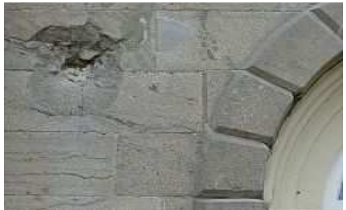
Marque de canon sur la façade de l'église Cannon mark on the church facade