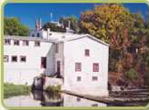
Le moulin Légaré