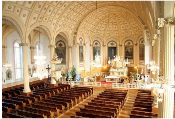
Intérieur de l'église de Saint-Eustache

Monument et lieu historique, l'église de Saint-Eustache fut érigée entre 1780 et 1783. En grande partie démolie lors des affrontements du 14 décembre 1837, elle est reconstruite en 1841 puis agrandie en 1906. La voûte en berceau continu, qui offre une acoustique unique, permet à l'Orchestre symphonique de Montréal d'y enregistrer tous ses albums depuis plus de 20 ans.