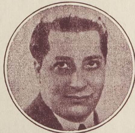
Musique de FRED. CARBONNEAU

Offert par la Maison N. G. VALIQUETTE Ltée