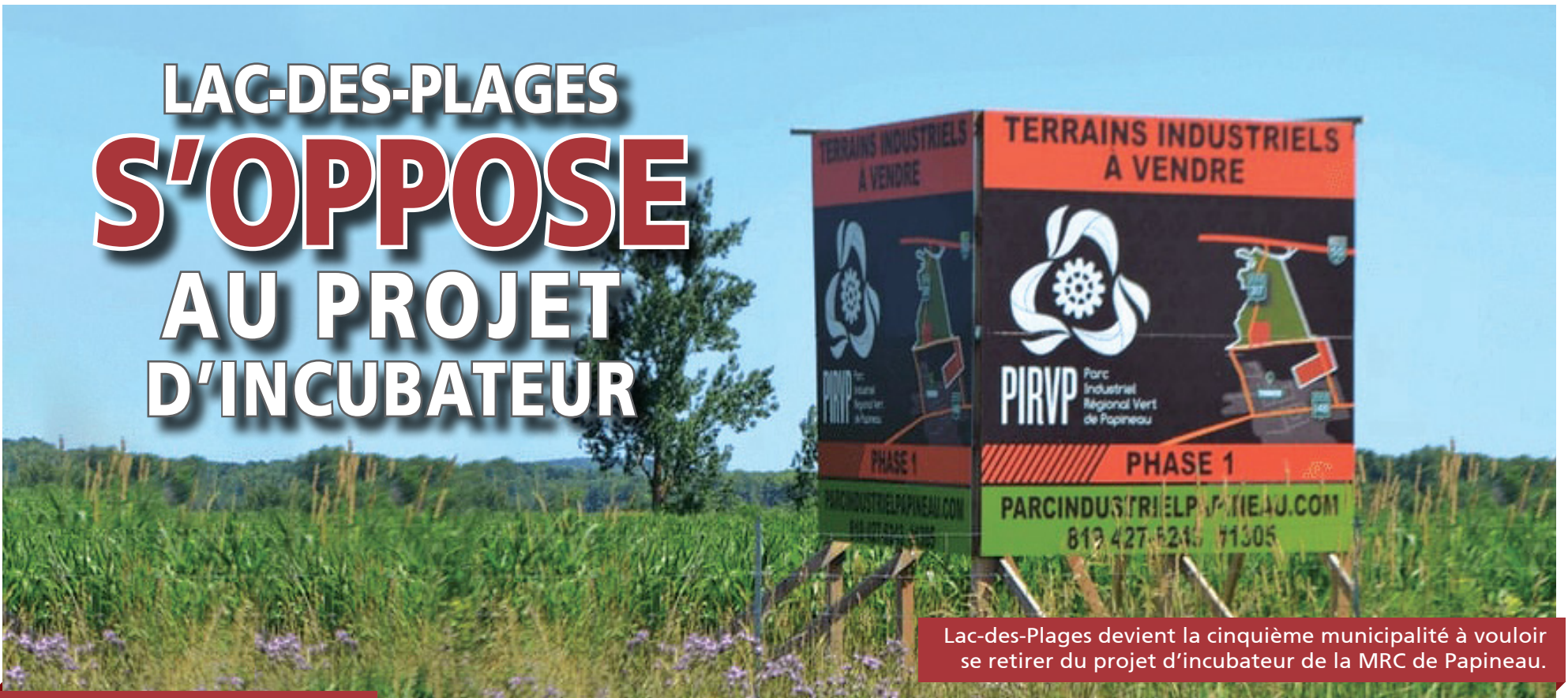
Lac-des-Plages devient la cinquième municipalité à vouloir se retirer du projet d'incubateur de la MRC de Papineau.

CLAUDIA Blais-Thompson claudia@journalles2vallees.ca