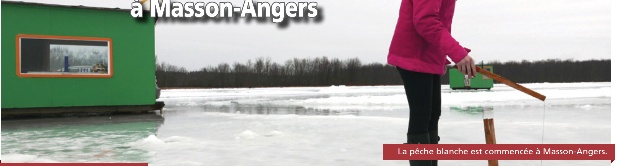
La pêche blanche est commencée à Masson-Angers.

CLAUDIA Blais-Thompson claudia@journalles2vallees.ca