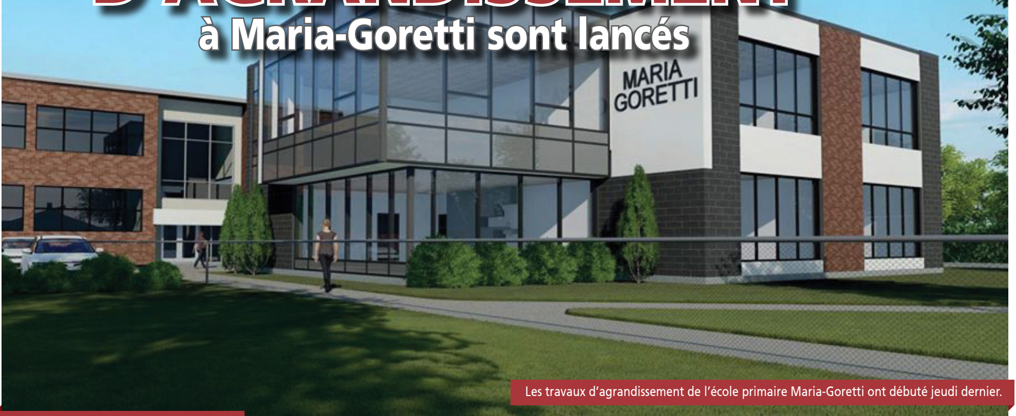
Les travaux d'agrandissement de l'école primaire Maria-Goretti ont débuté jeudi dernier.