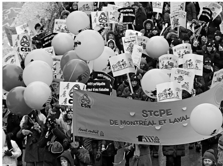
Environ 700 travailleurs des CPE de Montréal-Laval ont manifesté leur mécontentement hier.