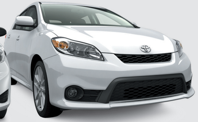
Modèle XRS illustré

RAV4 2012 Louez le RAV4 2RM 2012 à partir de 322$* PAR MOIS LOCATION 60 MOIS