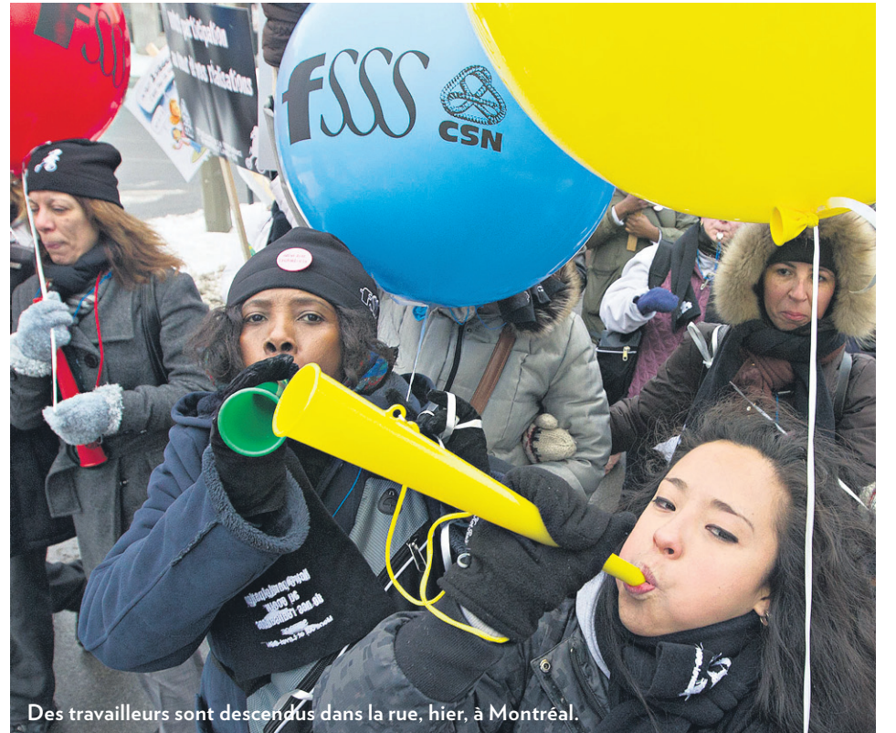
Des travailleurs sont descendus dans la rue, hier, à Montréal.

VINGT MILLE LIEUES SOUS LES GLACES Des scientifiques atteignent un lac préhistorique en Antarctique. PAGE A9