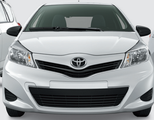
Modèle SE illustré