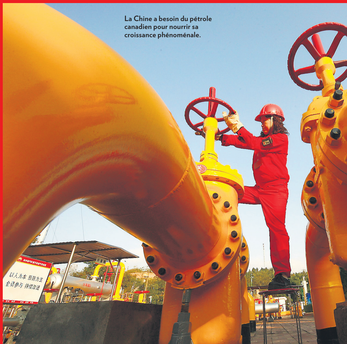
La Chine a besoin du pétrole canadien pour nourrir sa croissance phénoménale.