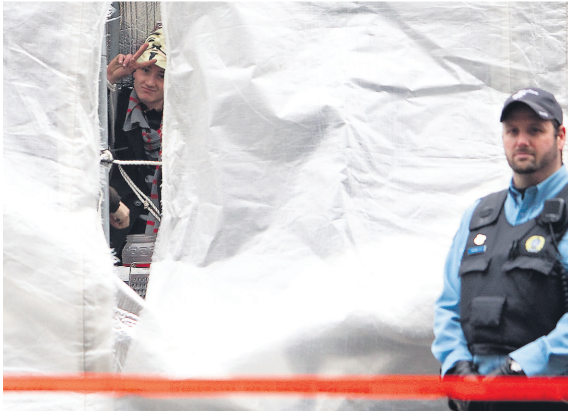
Pas moins de 27 fonctionnaires ont été mobilisés le 25 novembre pour démanteler les quelque 200 tentes et abris improvisés du campement à Montréal (notre photo). L'opération de nettoyage du square Victoria à la suite de l'expulsion des manifestants a coûté à elle seule 25 000 $.

plusieurs occupants s'étaient plaints d'importants problèmes de sécurité. Le campement avait attiré de nombreux sans-abri et des personnes aux prises avec des problèmes de santé mentale ou de toxicomanie. L'expulsion des indignés avait d'ailleurs été décidée par l'administration Tremblay en raison des débordements observés dans les derniers jours du mouvement.