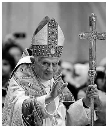
Le pape Benoît XVI.

Le pape Benoît XVI a plaidé pour « un profond renouveau de l'Église » à Rome, à l'ouverture d'un symposium organisé par l'Église catholique pour éviter les scandales pédophiles qui l'ont entachée au cours des dernières années. « Soulager les victimes doit être de la plus haute importance pour la communauté chrétienne », a-t-il dit. — AFP