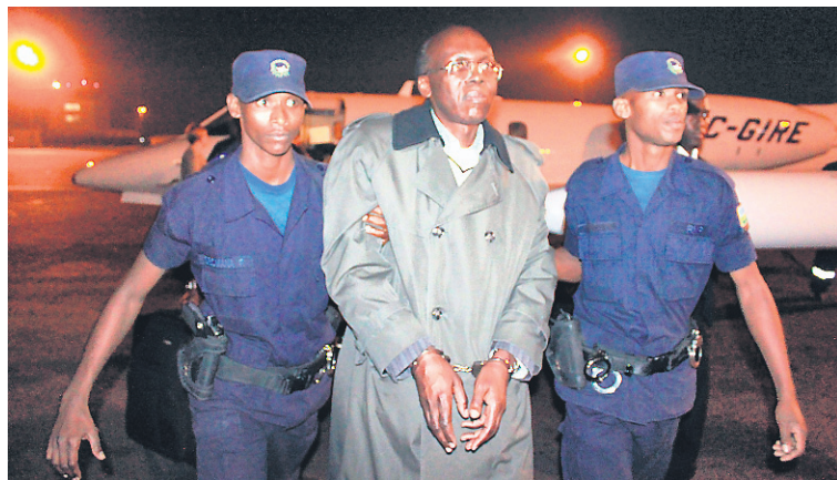
Léon Mugesera, à son arrivée à Kigali, au Rwanda, le 24 janvier dernier.

Selon lui, Léon Mugesera n'a pas les ressources financières pour s'offrir un avocat à long terme. « Il n'y a pas d'aide juridique au Rwanda et nous sommes placés devant