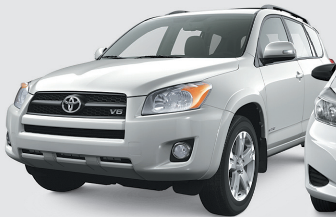
Modèle 4RM V6 Sport illustré