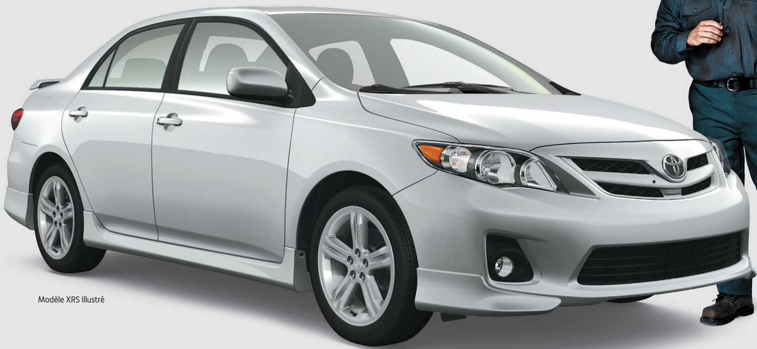
Modèle XRS illustré

POURRIEZ-VOUS ROULER EN TOYOTA? J'AI BESOIN DE VACANCES.