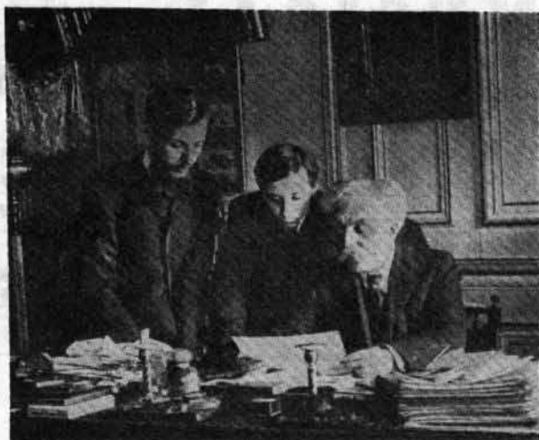
Gabriel Fauré dans son cabinet de travail, en compagnie de ses deux fils, au moment de sa nomination à la direction du Conservatoire de Paris, en 1905.