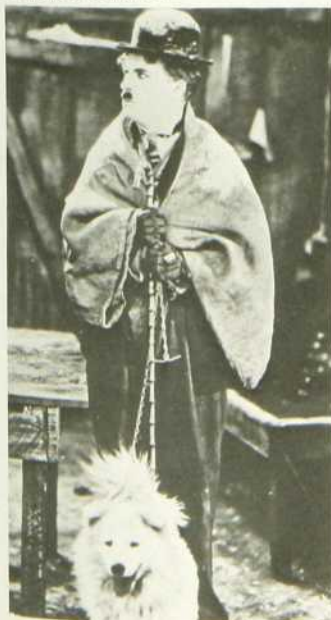
La Ruée vers l'or

Résultat de quatorze mois de tournage, La Ruée vers l'or , a été l'un des plus gros succès financiers du muet et un triomphe personnel pour son auteur.