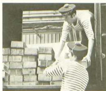
L'Or en exil

Ne manquez donc pas le premier épisode de la série Le Dossier secret des trésors , le dimanche 14 septembre à 20 h 30, à la télévision française de Radio-Canada. Les révélations de ce dossier sont stupéfiantes. L'Or en exil , coproduction France-Sénégal, est une présentation de Telecip.