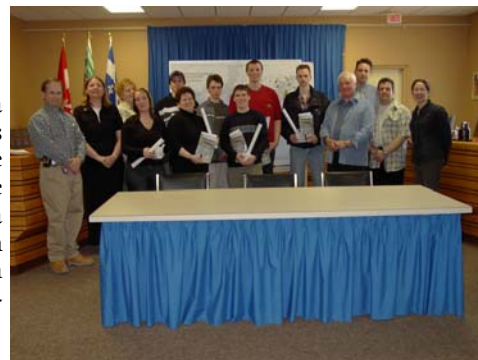
Des jeunes diplômés désirant trouver un emploi dans la région on pu établir des contacts lors de cette tournée.

Le Carrefour jeunesse-emploi de la Jamésie, en collaboration avec plusieurs partenaires de la région dont le CLD de la Baie-James, lançait « la Tournée de l'emploi 2004 ». Ce projet vise à contrer et prévenir l'exode des jeunes en facilitant leur retour et leur intégration professionnelle et sociale dans leur région d'origine, soit le Nord-du-Québec.