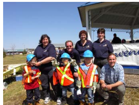
Quelques futurs travailleurs forestiers?

Comme partout en province, plusieurs activités se sont déroulées dans le Nord-du-Québec. Nous profitons de l'occasion pour féliciter tous les organisateurs de ces événements. Encore cette année, l'expérience fut un succès!