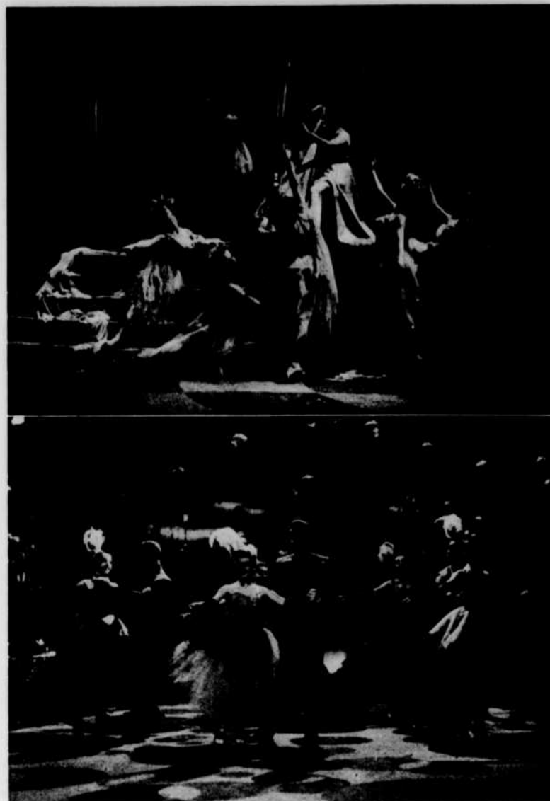
A preuve que les costumes, bien plus que les décors, peuvent créer l'atmosphère d'un spectacle et le "situer", voici des scènes chorégraphiques, photographiées durant deux émissions du programme Tourbillon , à CBFT. Tout le monde jugera du premier coup d'oeil qu'il s'agit: en haut, d'une fantaisie de la Grèce classique; en bas, d'une soirée viennoise.