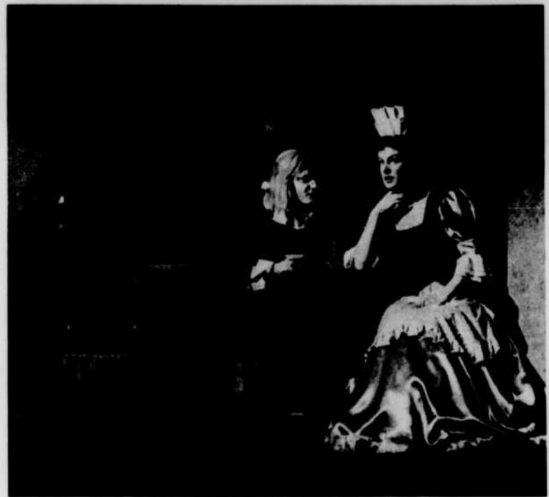
Deux costumes seulement, avec décors presque inexistant : cela suffit à faire revivre dans sa psychologie et son époque l'Avare de Molière.

Il est difficile d'imaginer un Molière sans costume. Sans décor, les costumes bien choisis suffiraient à situer l'action au moins dans le temps et à suggérer l'atmosphère dans laquelle vivent les personnages. Abstraction peut être faite du décor, mais comme les personnages doivent être présents, il faut les habiller d'une façon appropriée;