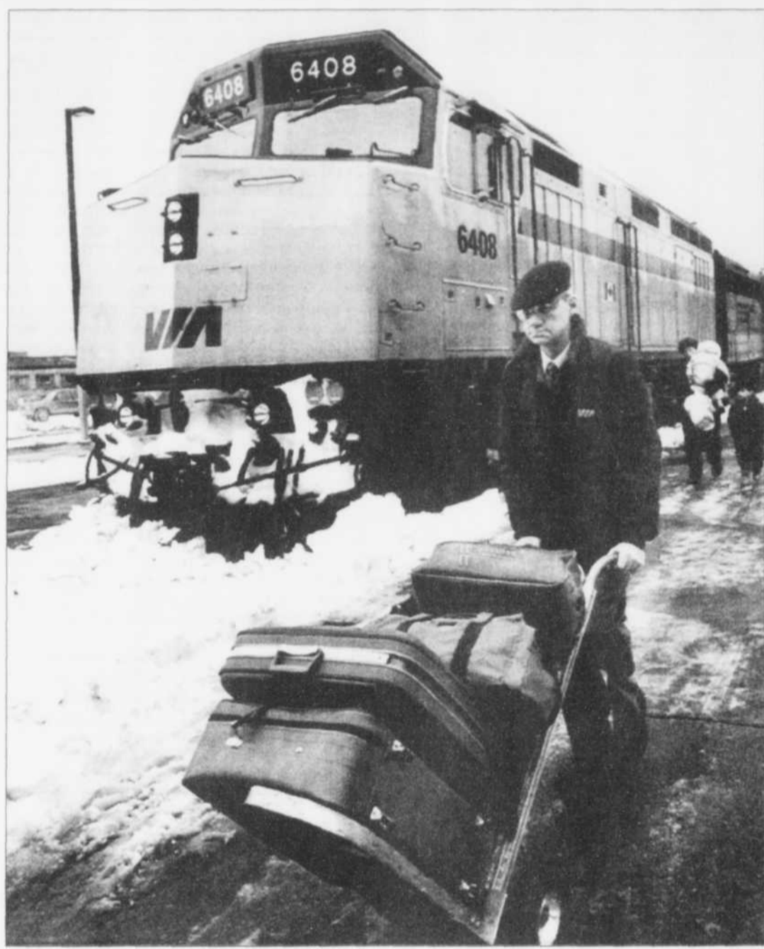
Depuis 1993, alors que 24 000 passagers empruntaient le Chaleur, VIA a enregistré une croissance de 45 % de sa clientèle entre Montréal et Gaspé.

Ce train a bien sûr augmenté son taux de récupération des coûts depuis 1993. Cette donnée n'est pas encore disponible pour la dernière année, mais elle dépasse 50%, la meilleure performance des trains régionaux au Québec, sinon au Canada.