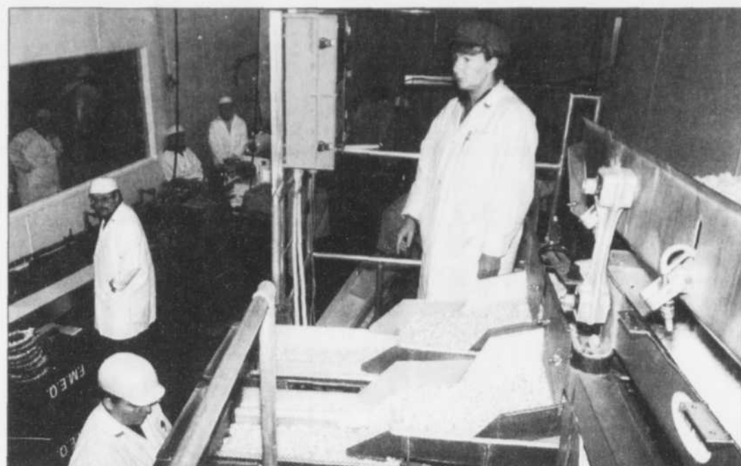
Installée à Matane depuis 1966, l'usine procure du travail à près de 200 personnes.