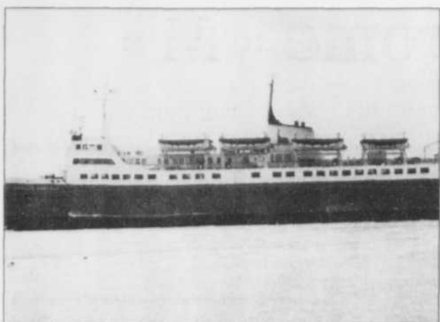
COLLABORATION SPÉCIALE: ROMAIN PELLETIER Le Camille-Marcoux.