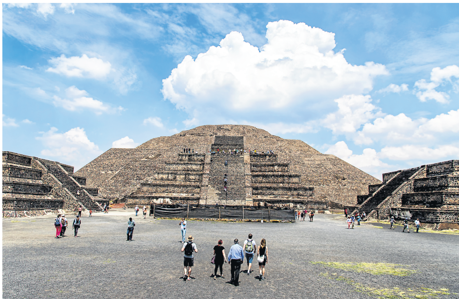
Impossible de résister à l'envie de grimper au sommet de la plus grande pyramide de Teotihuacan pour voir la vue sur l'impressionnant site.

Inutile d'inventer quoi que ce soit lorsqu'on se retrouve devant les majestueuses pyramides de Teotihuacan. Même en plein soleil, peu importe l'âge, impossible de résister