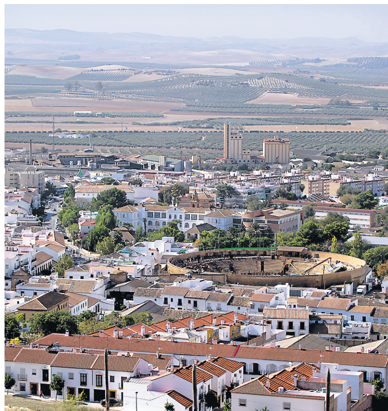
C'est au-dessus des arènes d'Osuna que Daenerys a chevauché son dragon lors de la cinquième saison du Trône de fer .

Deux ans après, Osuna aime à se souvenir du temps où les acteurs de la série — tel «le beau gosse» Michiel Huisman — arpentaient ses rues et où les fans se massaient devant leur hôtel «comme à Hollywood».