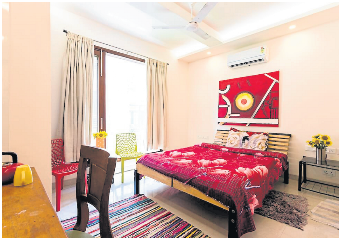
Combien pour une nuit dans cette chambre privée, située dans un immeuble récent de New Delhi? Vingt dollars.

dans un camion au fond d'un jardin de Clermont, dans les Landes. Le camion (avec intérieur bardé en bois, précise l'annonce) comprend un réchaud au gaz, mais pour les toilettes, il faut utiliser celles du propriétaire.