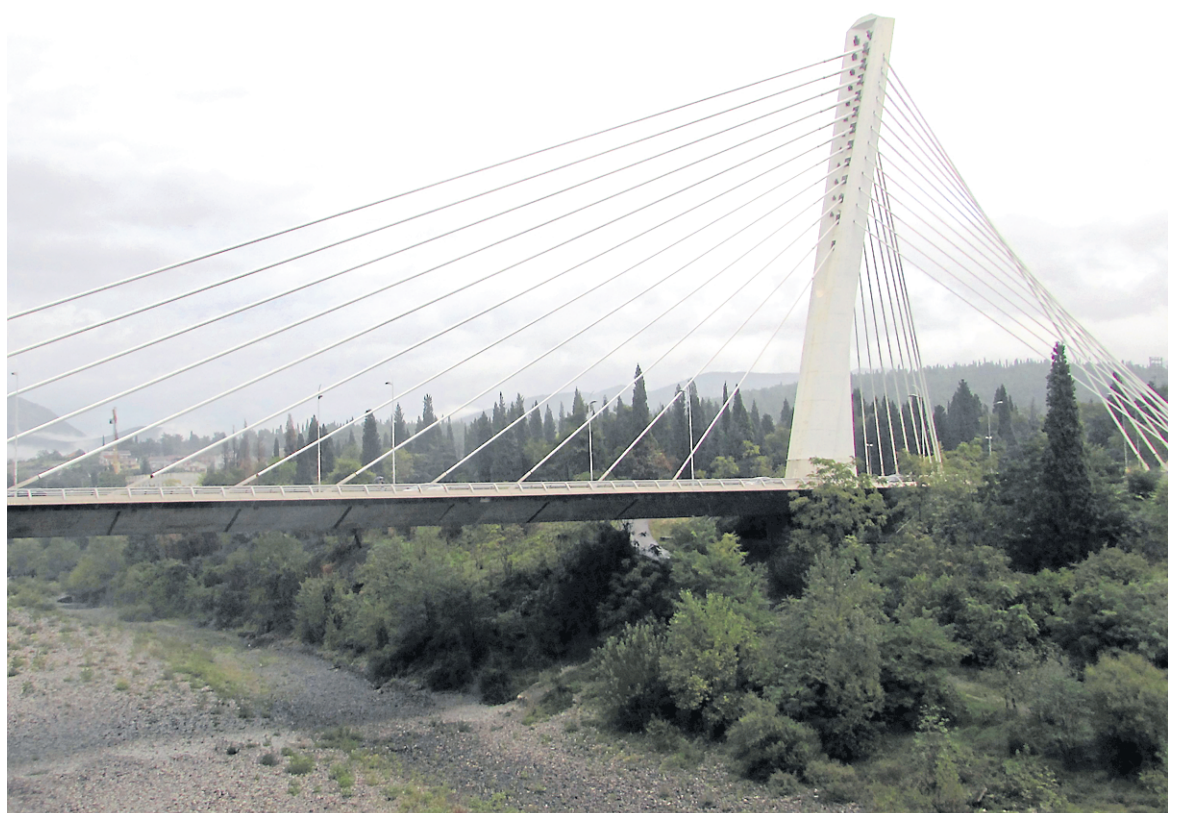
Le pont du Millénaire, un pont à haubans, est une des rares extravagances à Podgorica, la capitale du Monténégro.