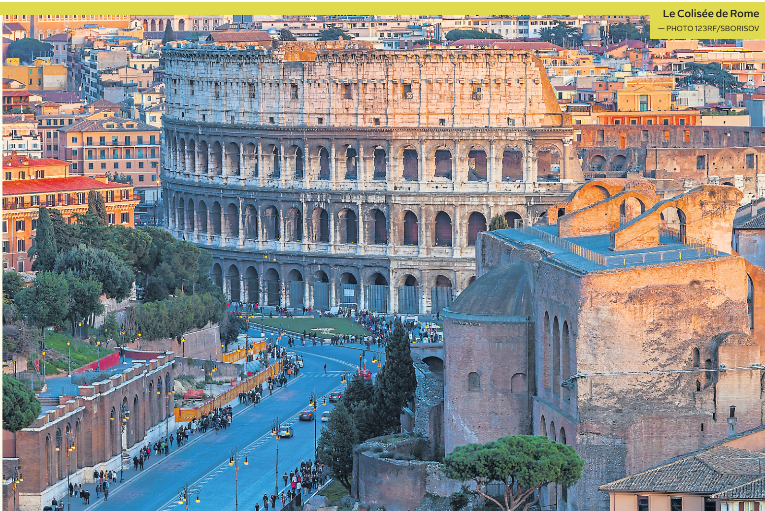
Le Colisée de Rome

Même fréquentée par des hordes de touristes, Rome, par son histoire, son architecture et sa cuisine, mérite qu'on la visite et surtout que l'on s'y attarde, en bambochant tranquillement. Et pour ce rythme que nous avons pris, cette insouciance et cet abandon qui nous habitaient, nous avons en quelque sorte eu l'impression que nous étions seuls au monde. Ennuyant, une semaine à Rome? Absolument pas.