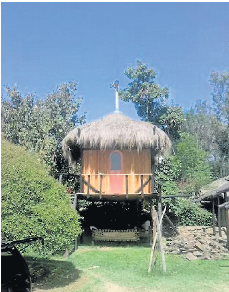
Au Kenya, il est possible de louer cette cabane sur pilotis pour 18 $ la nuit.

Consultez la fiche sur Airbnb : fr.airbnb.ca/rooms/8343634