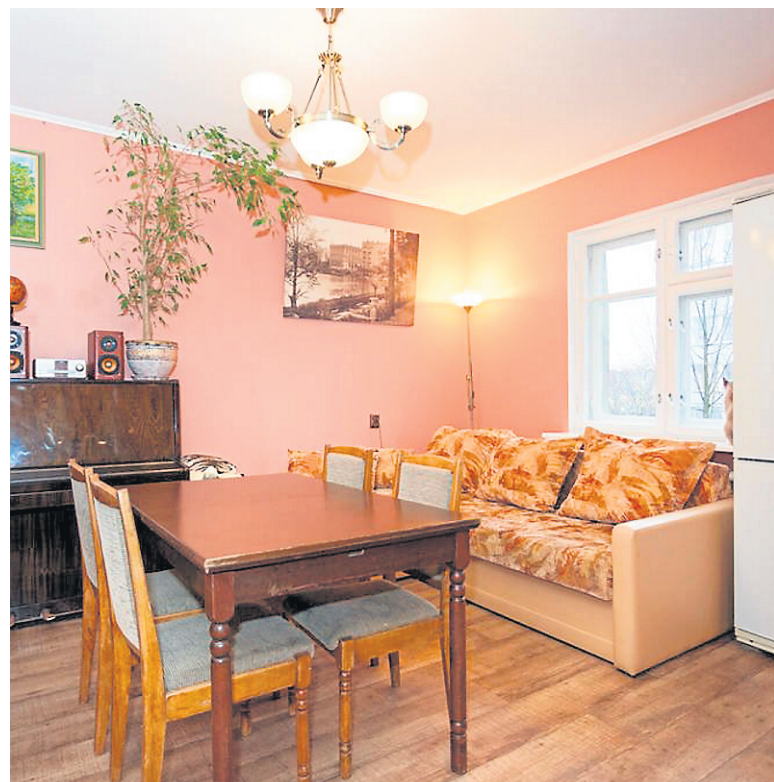
En Russie, ce moelleux divan est offert aux voyageurs pour 14 $ la nuit.