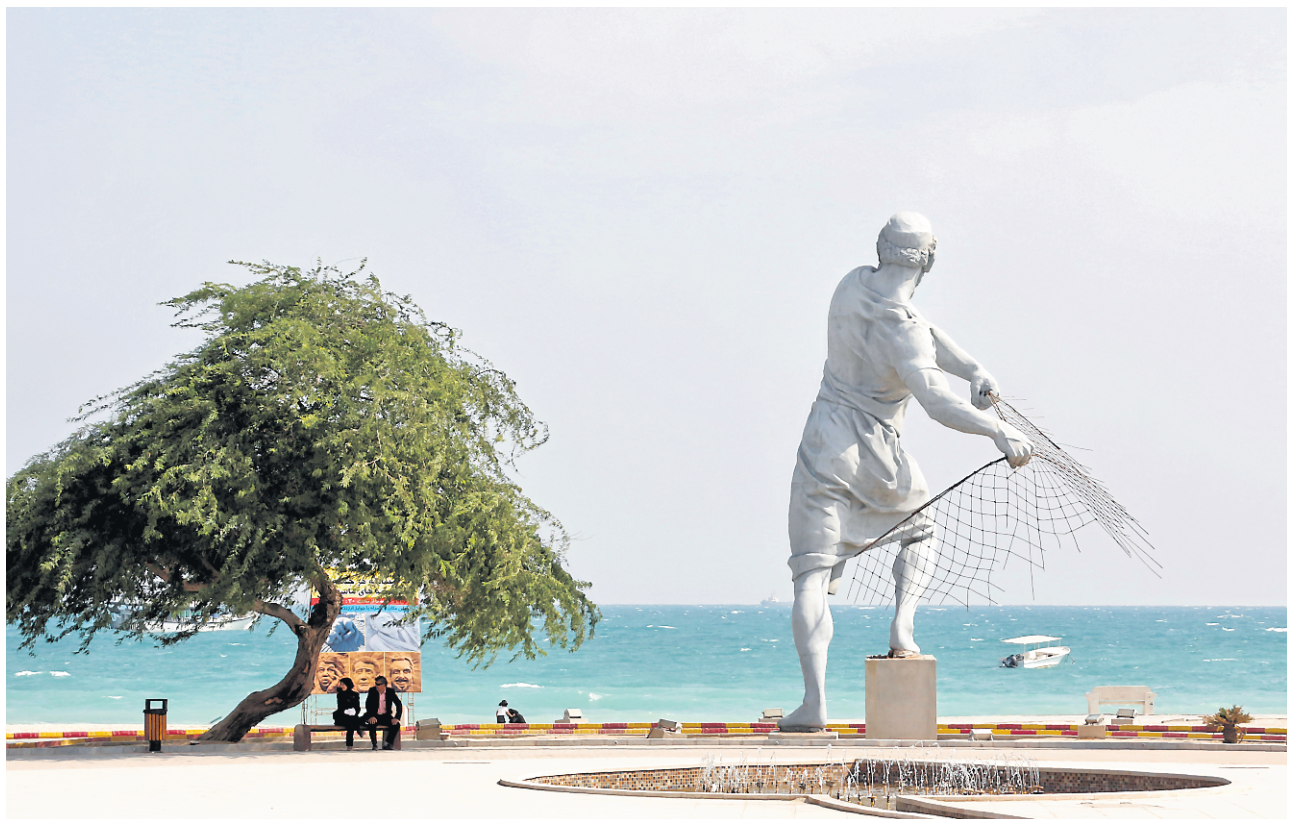
Les Iraniens investissent dans le développement de Kish, en espérant que ses installations artistiques et ses plages de sable blanc attirent les touristes dans la région.