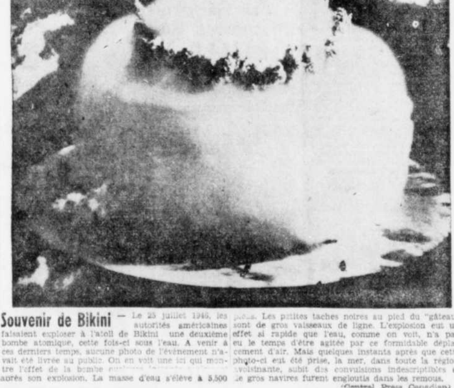
Souvenir de Bikini — Le 23 juillet 1946, les autorités américaines faisaient exploser à l'atoll de Bikini une deuxième bombe atomique, cette fois-ci sous l'eau. A venir à ces derniers temps, aucune photo de l'événement n'avait été livrée au public. On en voit une ici qui montre l'effet de la bombe sur le gros navire furent engloutis dans les remous.

Température détaillée Pronostics de Dorval pour les Cantons: Clair, puis couvert du soir. Après-midi, suivi de pluie légère dans la soirée. Le temps s'adoucitra durant la journée. Vents légers. Maximum prévu aujourd'hui à Sherbrooke 44. La gelée a été forte durant la nuit, mais le mercure dépassera 40 dans la plupart des régions de la province, aujourd'hui. Une tempête des Carolines va probablement apporter de la pluie près de la frontière américaine ce soir.