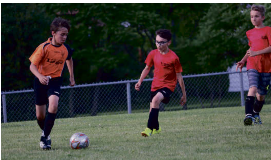
L'ASMAV présentera son tournoi de fin de saison durant le week-end, à Acton Vale.