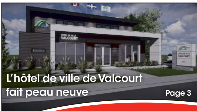
L'hôtel de ville de Valcourt fait peau neuve