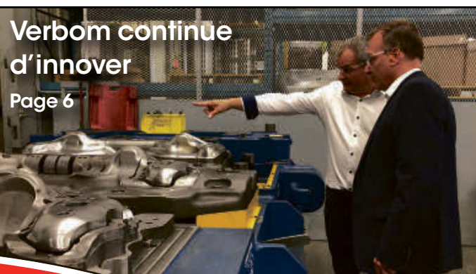
Verbom continue d'innover