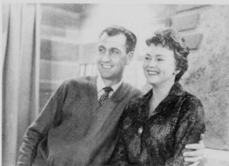
"Toi et moi" ou la vie à deux