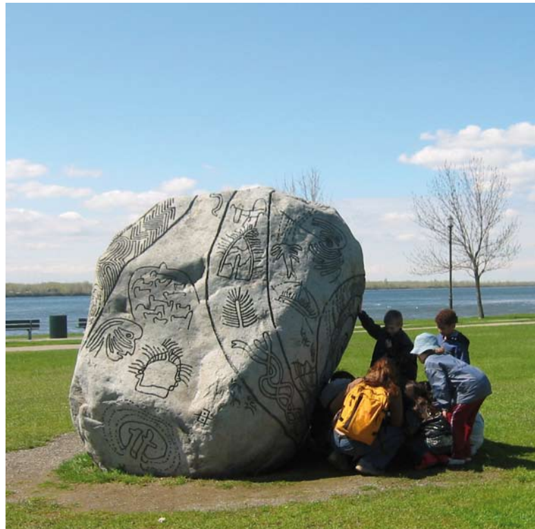
3 Story Rock examinée de près par les enfants lors d'une visite éducative du Musée plein air de Lachine en 2003.

Le directeur du Musée de Lachine, Marc Pitre