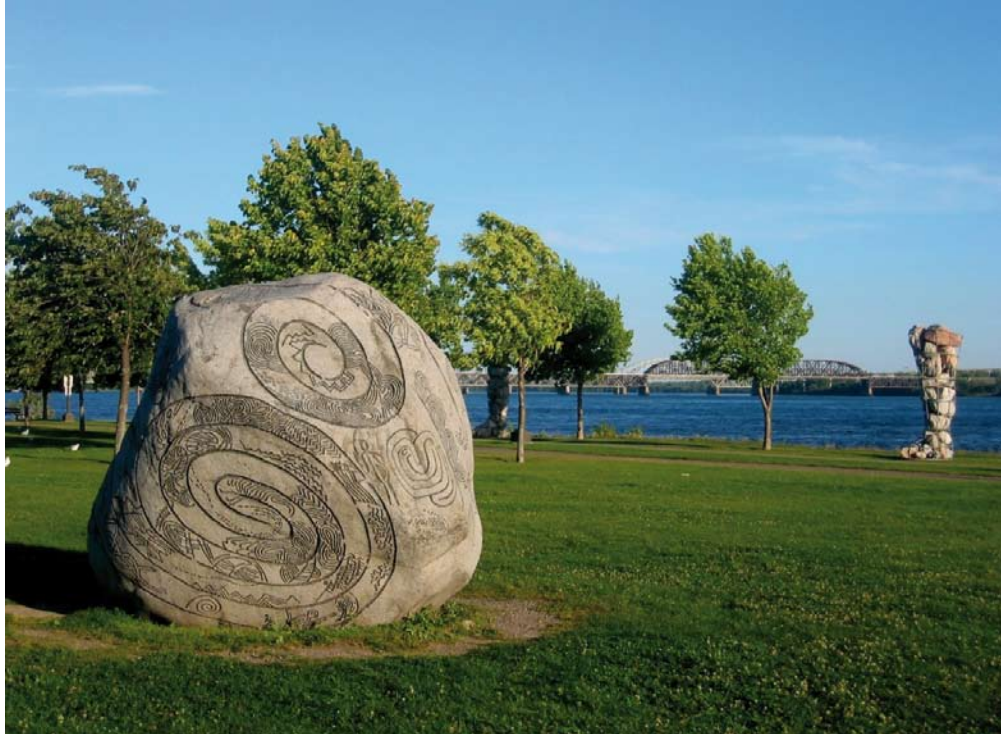
2 Story Rock , 1986, dans le parc René-Lévesque. Bill Vazan a réalisé cette œuvre durant l'un des symposiums qui ont jeté les bases du Musée plein air de Lachine.