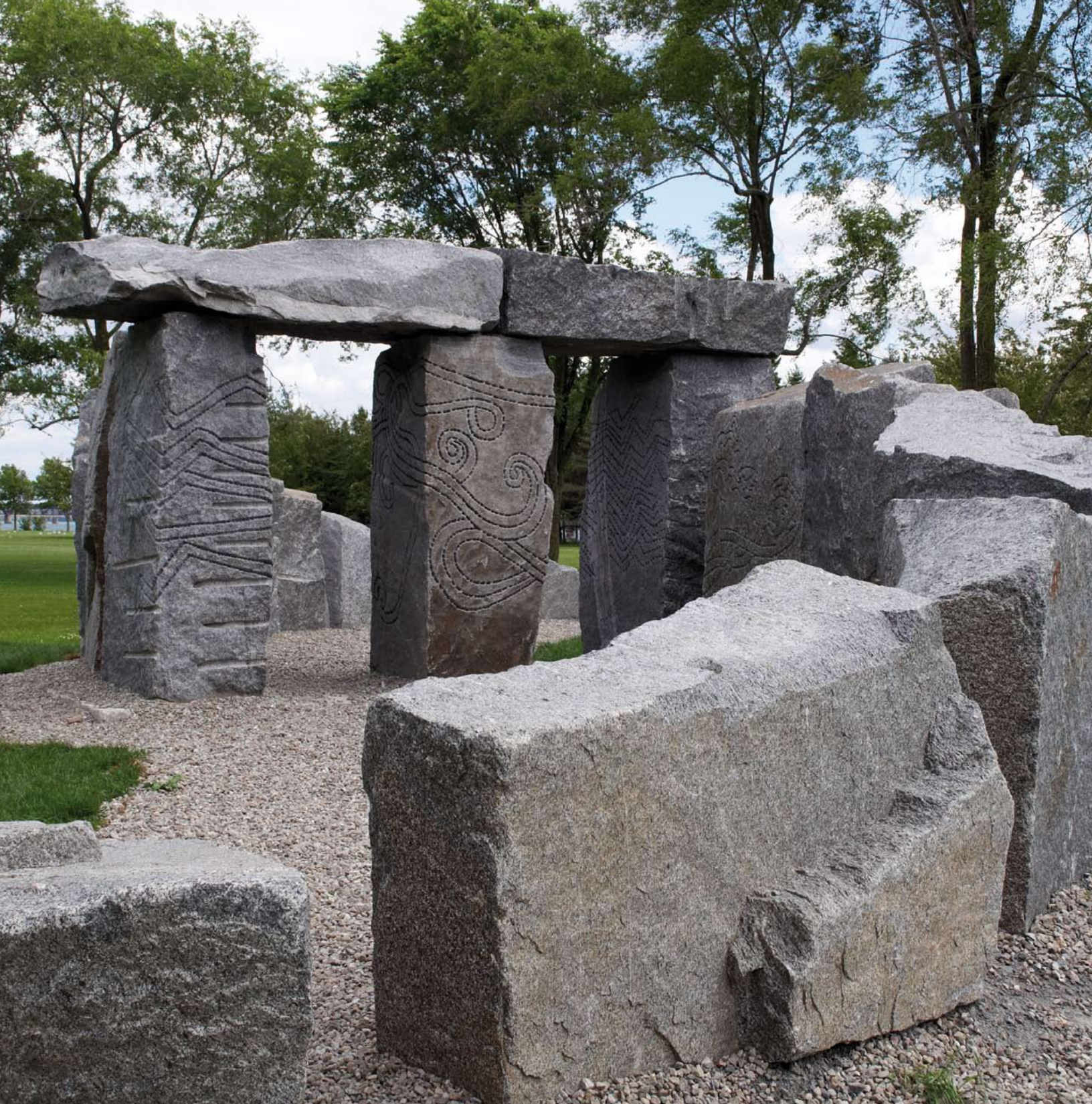
20 Vortexit II , 2009, vue du portail en direction du lac Saint-Louis.