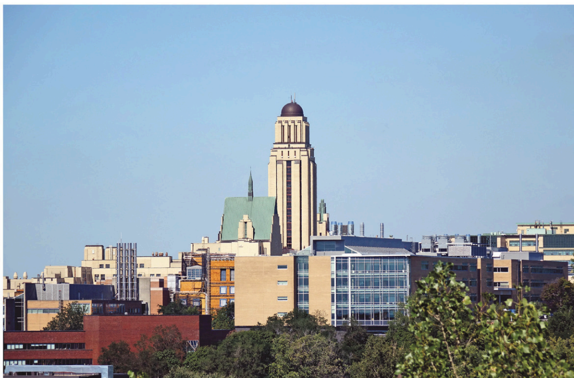
GÉRALD DALLAIRE LE DEVOIR

Des chercheurs en sécurité informatique ont indiqué lundi avoir découvert un lien potentiel entre la Corée du Nord et la vague