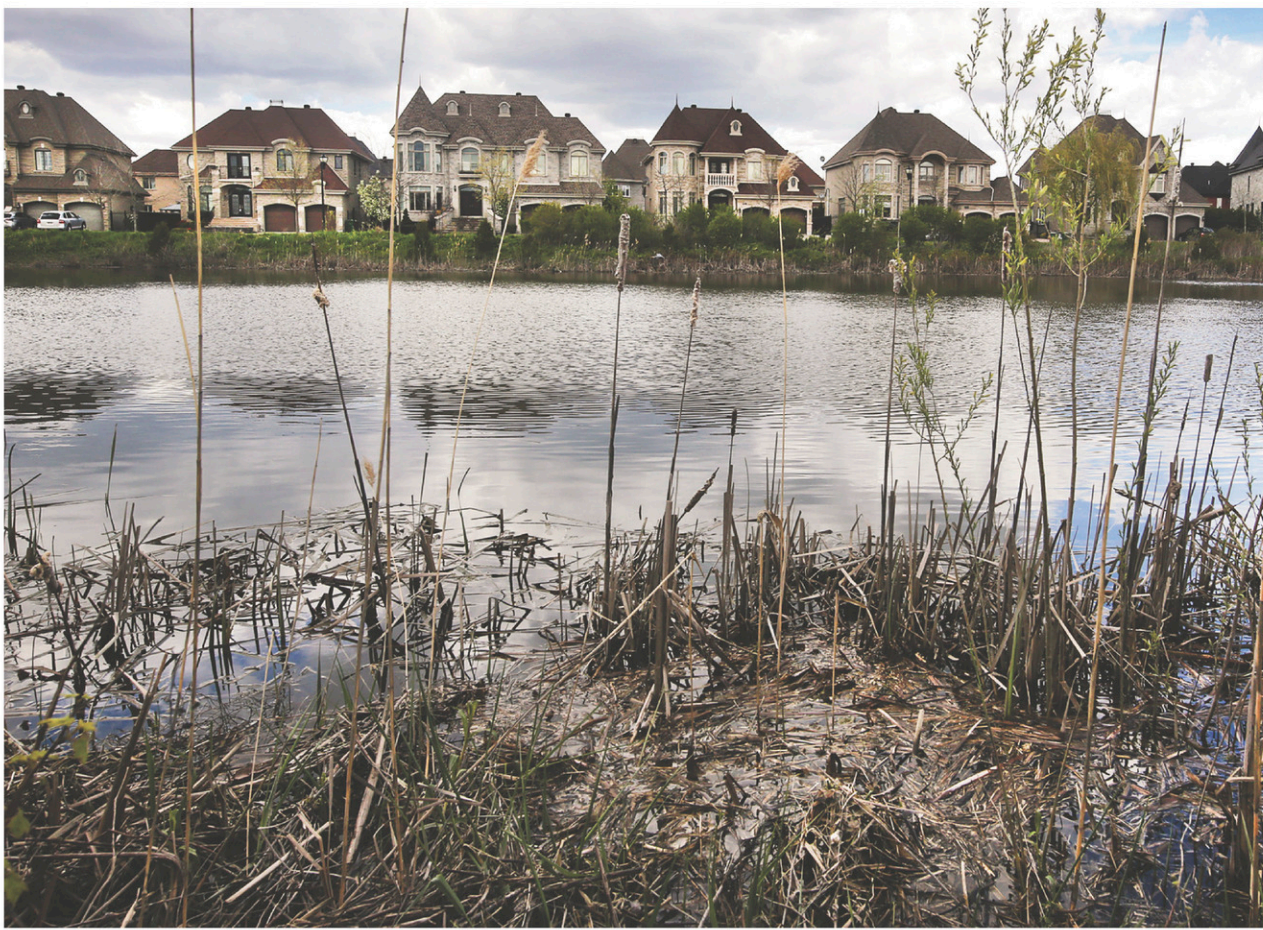
Pierrefonds-Ouest, comme plusieurs secteurs résidentiels au Québec, a été durement touché par les inondations des derniers jours.

Pour les promoteurs, les citoyens ont une mauvaise lecture de la situation, puisque les terrains en «zone inondable» ne sont pas ceux visés pour la construction du projet, mais plutôt ceux qu'elle entend laisser à la Ville de Montréal