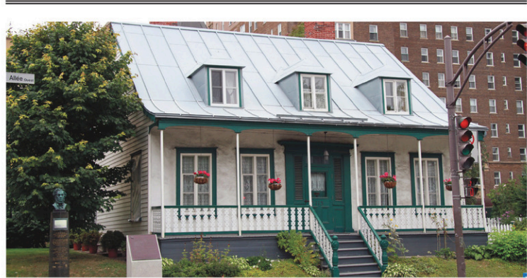
Le cottage est situé rue Grande Allée face à la rue Cartier.