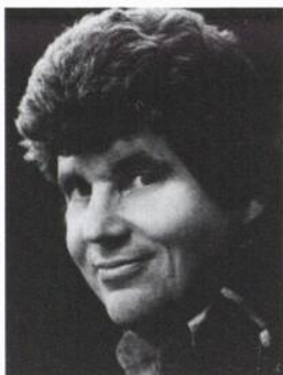
AUTEUR : COLIN HIGGINS

Colin Higgins est né en 1941 sur l'île française de Nouvelle-Calédonie dans le Pacifique Sud d'un père américain et d'une mère australienne.