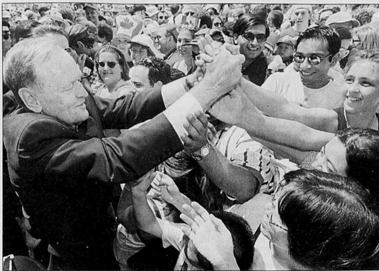
Le premier ministre Jean Chrétien a distribué les poignées de main au milieu d'une foule enthousiaste à Ottawa.

De nombreux spectacles avaient également été prévus ailleurs au pays, notamment au Québec où, cette fois,