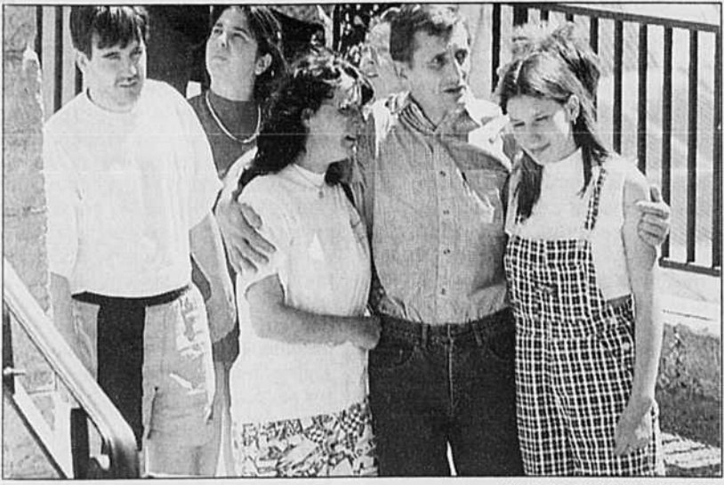
Atterrés, des proches des victimes sont accourus sur les lieux du drame.