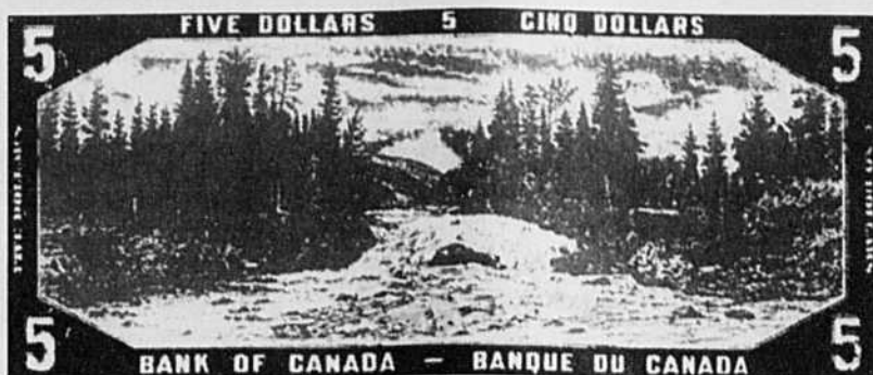
Ce dessin de l'ancien billet de 5 $ montre la chute du Neuf, sur la Batiscan.

Pour la coalition Eau-Secours, ce projet «met en péril toute l'infrastructure touristique développée au fil des ans» et ne progresse que parce que ses promoteurs, privés et publics, en cachent les enjeux à la population locale, une attitude qualifiée de méprisante par la coalition dans une lettre adressée au député local, Ro-