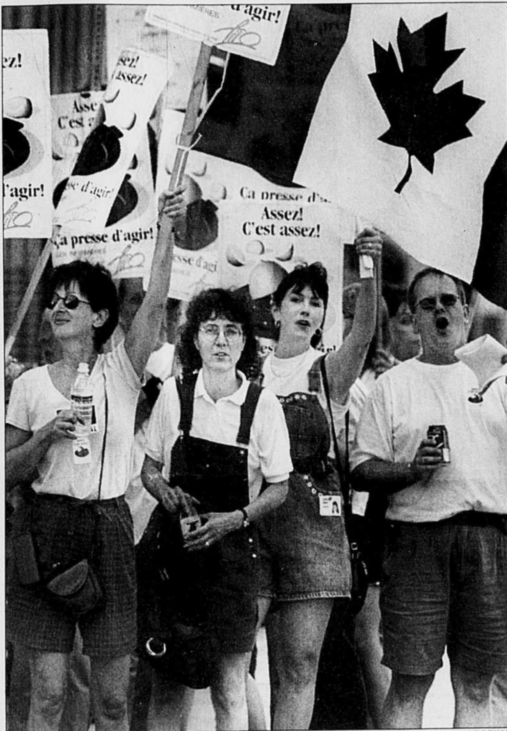
Malgré la menace d'une loi spéciale, les infirmières étaient toujours dans la rue, hier, pour poursuivre leur grève illégale. Le conseil des ministres s'est réuni en soirée pour élaborer le contenu de la loi spéciale au sujet de laquelle devra voter l'Assemblée nationale aujourd'hui.

CSN, CEQ, FTQ, médecins: les infirmières récoltent de nouveaux appuis