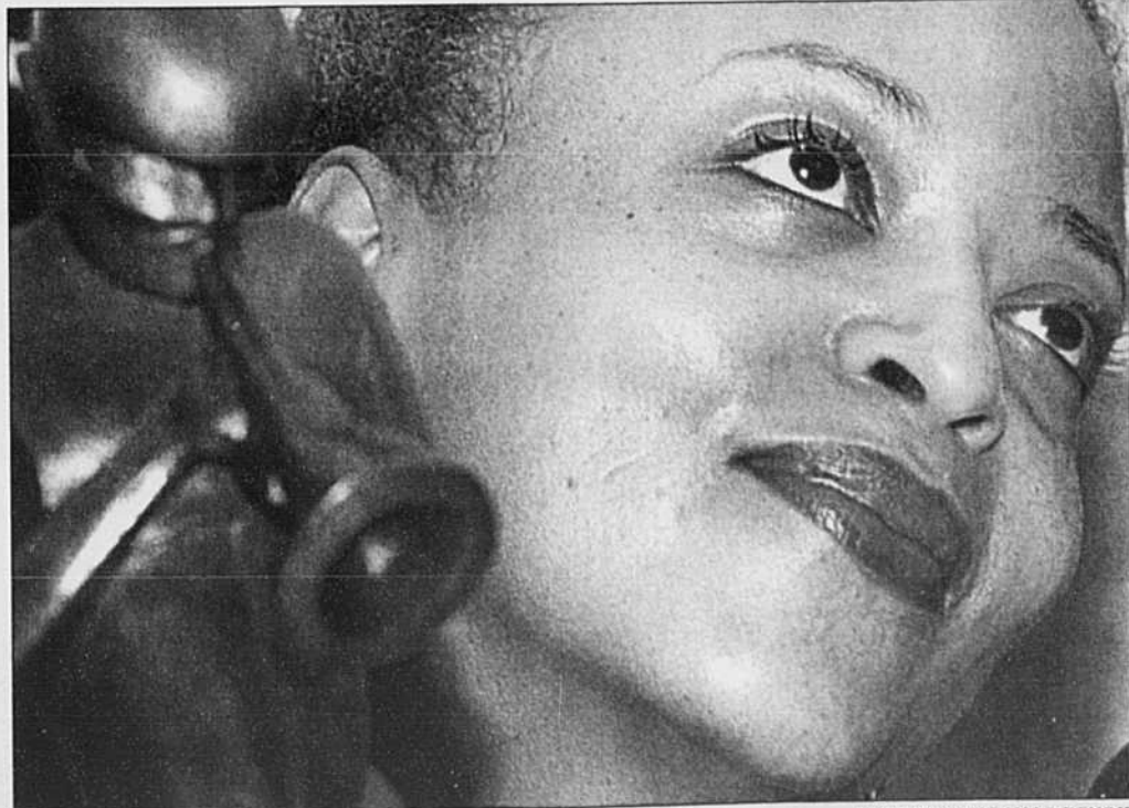
La chanteuse Cassandra Wilson est devenue hier la sixième lauréate du prix Miles-Davis remis dans le cadre du Festival international de jazz de Montréal.