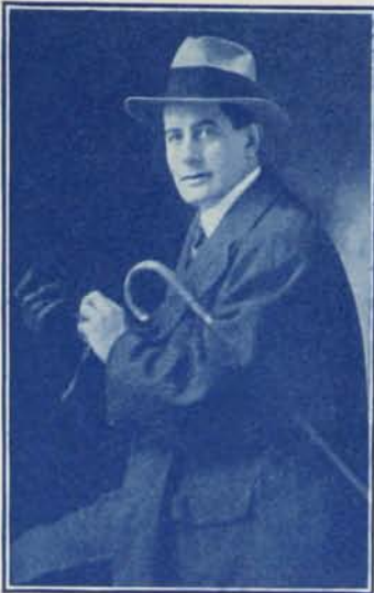
G. LEGRAND Un des auteurs