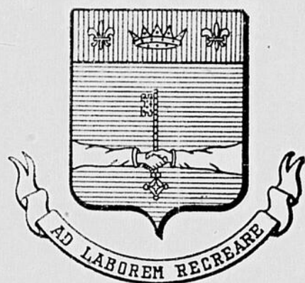
Les armoiries de Ville Saint-Pierre.