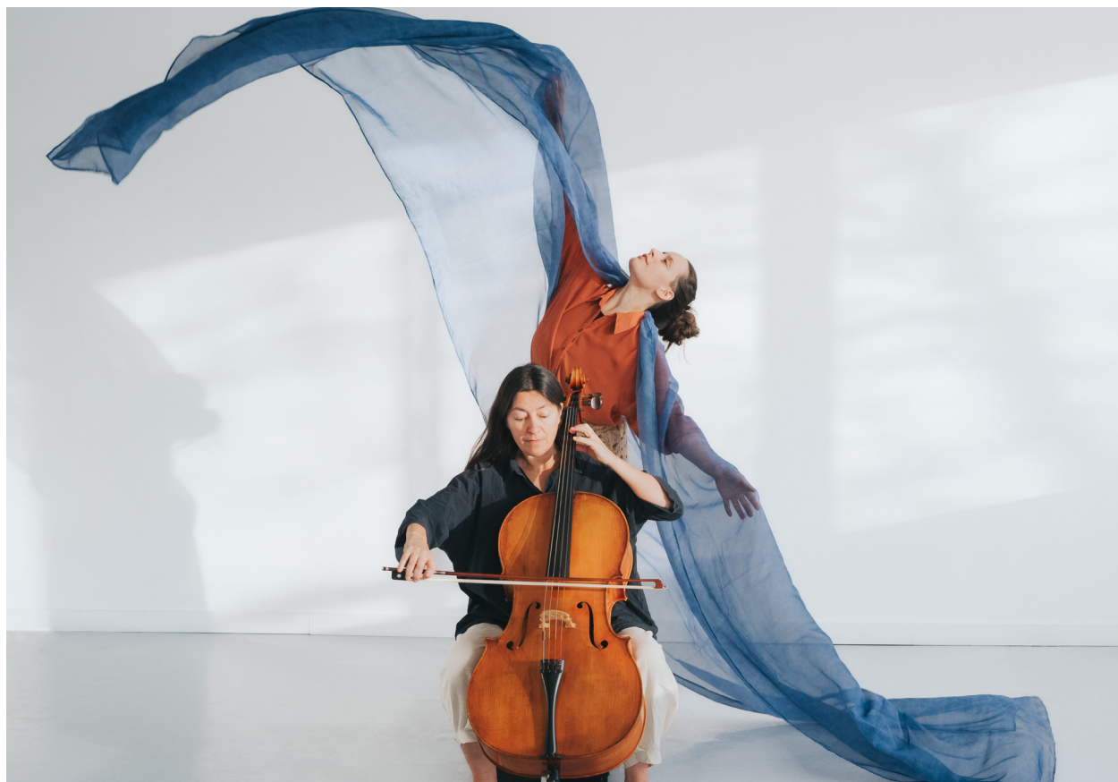
Le spectacle À corps d'âges de Tigouli sera présenté lors du Festival Petits bonheurs.

Le Gala de clôture et la remise des bourses se tiendront le 3 mai, à 15 h, au Centre culturel Desjardins. Cet événement est gratuit et ouvert à tous.