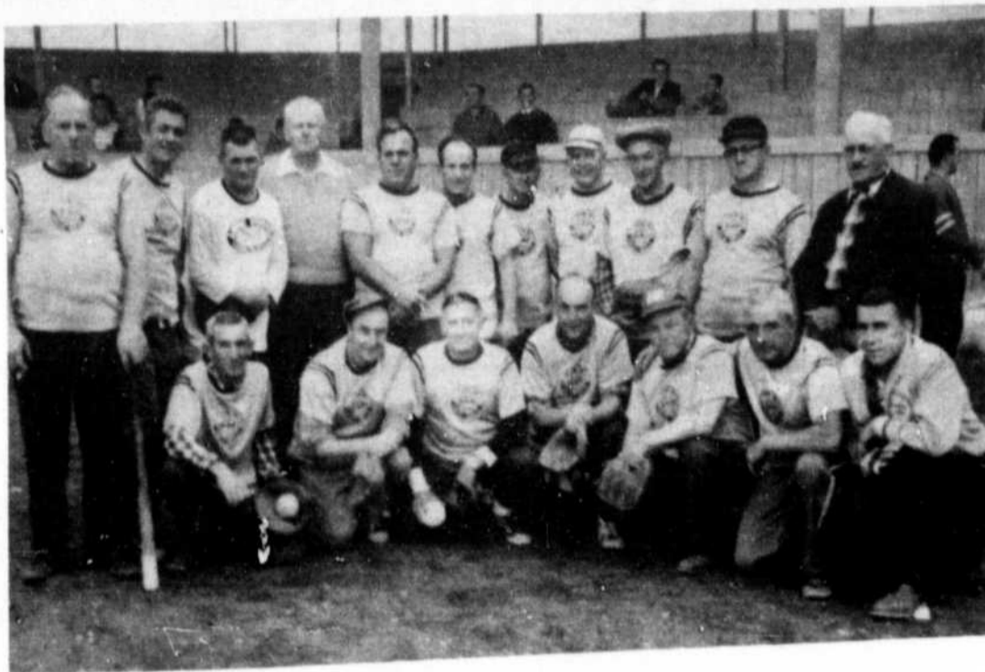
JOUTE AMICALE MASSON-BUCKINGHAM