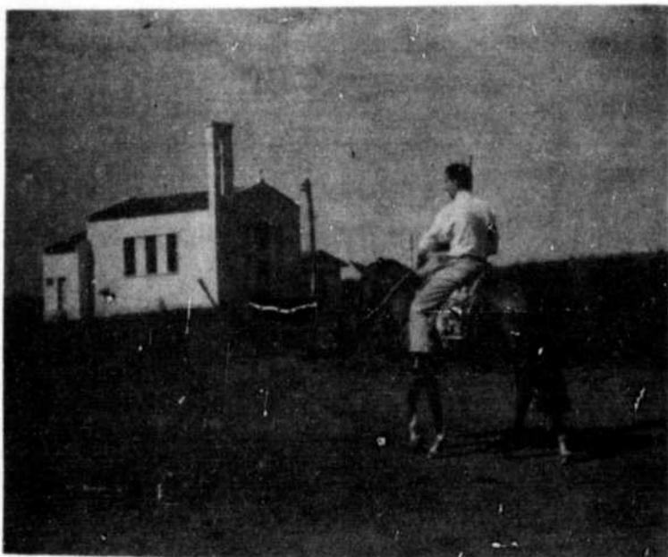
Ici son église, qui n'est pas tellement différente de la nôtre, sauf les arbres.