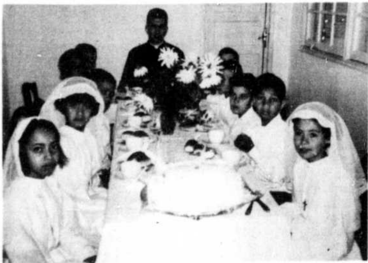
Enfin, l'abbé Prévost entouré de jeunes communiants. Ce magnifique résultat justifié à lui seul l'exil d'un enfant de la paroisse, dont nous sommes tous si fiers.