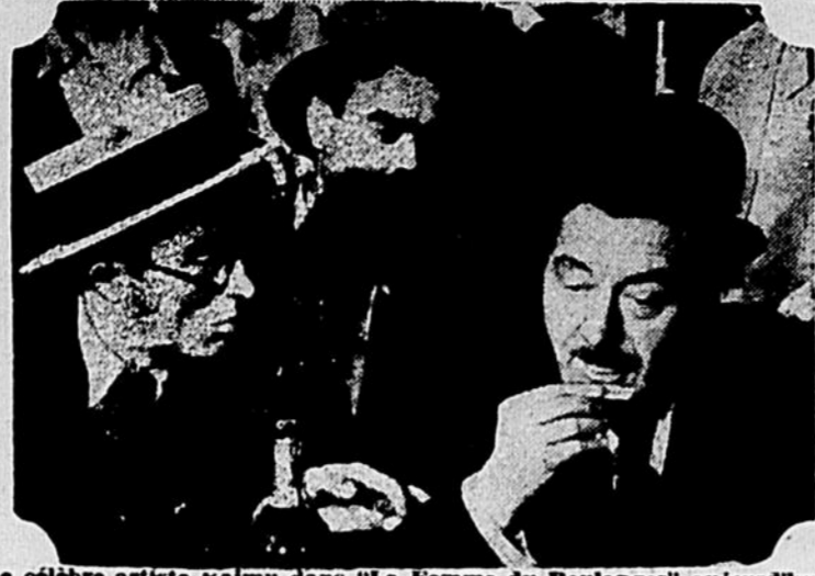
Le célèbre artiste Raimu dans « La Femme du Boulanger » aujourd'hui au Saint-Denis en programme double avec le documentaire dont on a tant parlé « Sommes-nous défendus? ».