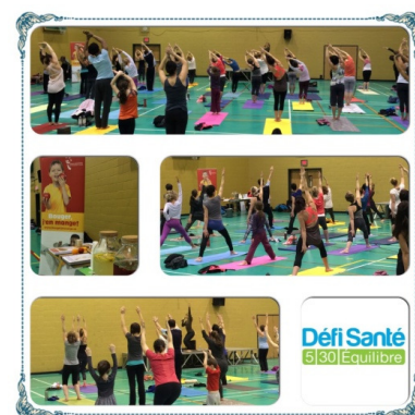
Des participants de l’activité Méga Yoga tenue à l’Université de Sherbrooke dans le cadre du Défi Santé 2015.