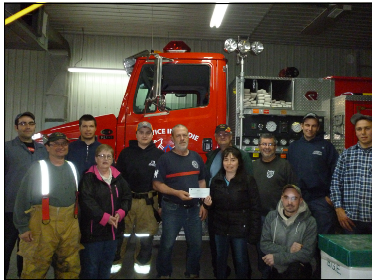
Les administratrices du comité théâtre du 100 ième .

Le tout s'est déroulé le mardi 22 mai dernier, à la Caserne. Nous avons choisi cet organisme, car il s'implique dans toutes les activités de la communauté, et ce bénévolement, ce qui fut dans nos objectifs pour les bénévoles du théâtre au 100 ième . Merci aux bénévoles du théâtre, vous faites partie de ce don !