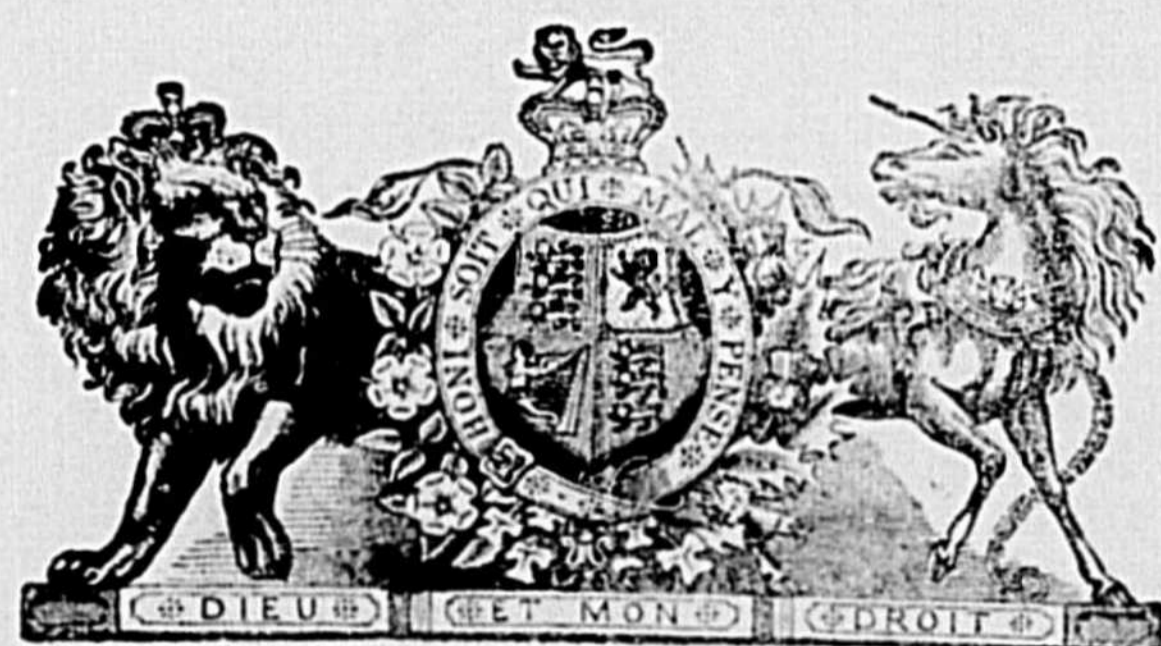
DISTRICT DE CHICOUTIMI

Aussi:—Agent pour le comté de Chicoutimi, de la célèbre compagnie "THE MANUFACTURER'S LIFE" and—ACCIDENT INSURANCE Co., Toronto.