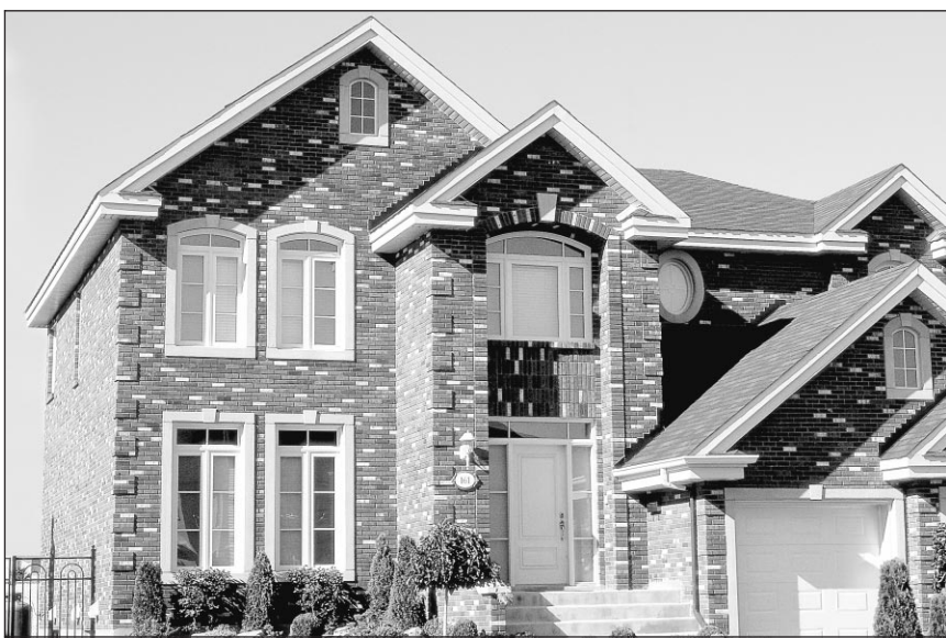
Cette maison certifiée Confort max (standard équivalent à R-2000) a été érigée par Construction Jean Houde et a remporté le prix Domus 1999.

Il était une fois une crise du pétrole, dans les années soixante-dix.