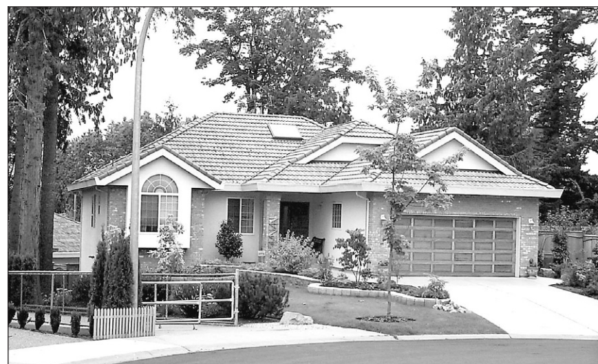
Cette maison certifiée R-2000 de la Colombie-Britannique a coûté environ 5 % de plus qu'une maison conventionnelle et a fait réaliser à ses propriétaires des économies de chauffage de l'ordre de 40 %.

Au Canada, à ce jour, plus de 8700 maisons sont certifiées R-2000. Au Québec : 329, dont 100 maisons Confort max, portent la marque R-2000.