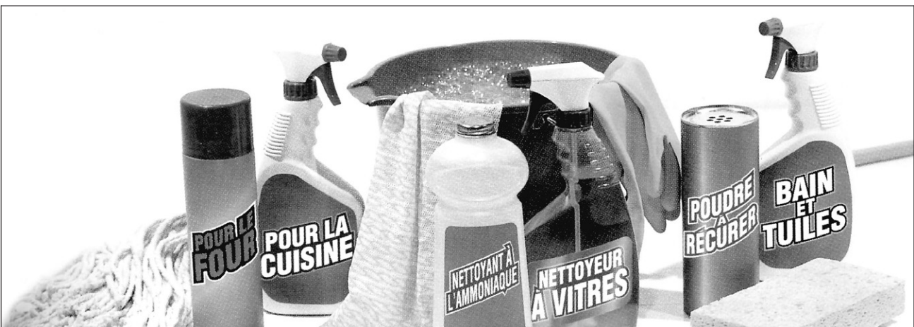
La SCHL rappelle qu'une maison « saine » devrait être récurée avec des produits non parfumés, non toxiques (comme le bicarbonate de soude) et que les produits de nettoyage courants sont une source de contaminants.

Surtout : fuir l'ammoniaque, suggère Bon ou nocif ? (Sélection du Reader's Digest). Même s'il est un excellent dégraissant, ses mauvais effets sont multiples : éruptions ou brûlures chimiques, émanations irritantes pour les yeux et les poumons. Même si les détergents ménagers en contiennent peu, il faut les utiliser et les ranger selon les instructions.