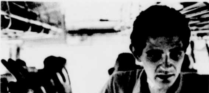
Jean-Pierre LEFEBVRE est l'invité d'André Pâquet, à «Cinéma d'ici», à 19 h 00.

Avec Paul Buissonneau, Guy L'Ecuyer, Christine Olivier, Yves Massicotte et Albert Millaire. «Le Sarcophage égyptien».