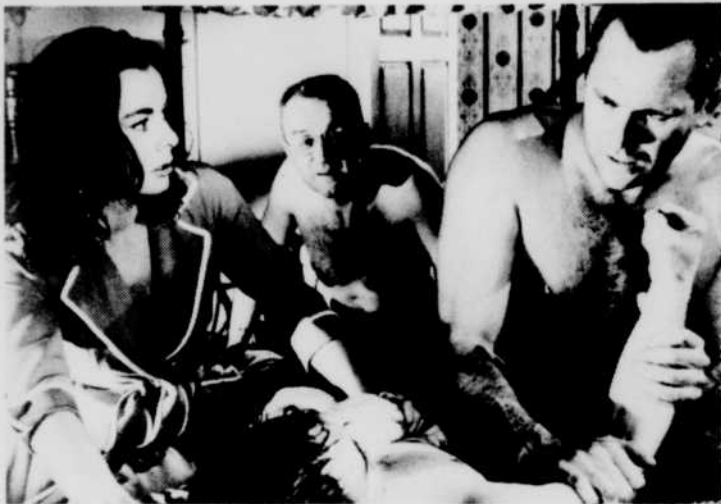
«Froid dans le dos», à «Billet de faveur», le samedi 25 à 20 heures.

Pour ajouter de la fantaisie aux plaisirs de votre été: