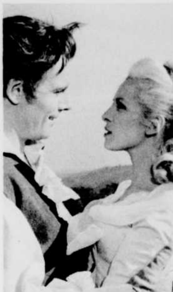
«Lagardère», le lundi à 19 h 30.