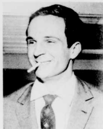
Jean-Pierre MELVILLE et François TRUFFAUT, deux metteurs en scène de policiers.

«Le Roman policier et les mass média», tel est le sujet du cinquième épisode de la série consacrée à ce genre romanesque et qui sera présentée dans le cadre de l'émission Horizons , le mardi 28 juillet à 21 h 30, à la radio de Radio-Canada.