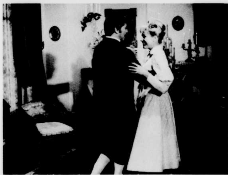
«Minouche», le mardi à 13 h 30.