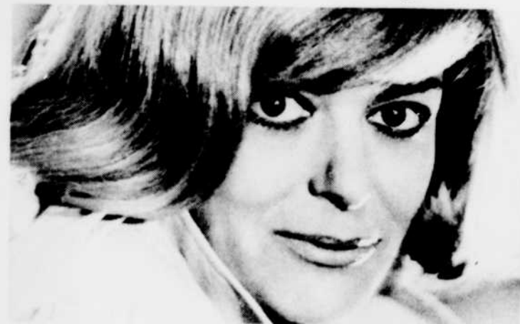
Mélina MERCOURI est de la distribution de «Gipsy» au «Cinéma», à 23 h 30.

1 h 15—CBVT—CINÉ-NUIT Les Chiens ou La Jeune Fille morte. Drame passionnel de Claude Faraldo, avec Ivo Garrani, Jean-Claude Roland, Huguette Hue et Françoise Fabian. Un homme condamné pour avoir accidentellement tué un autre homme qui voulait violer sa future femme, revient dans sa famille. (Franco-portugais 1966).