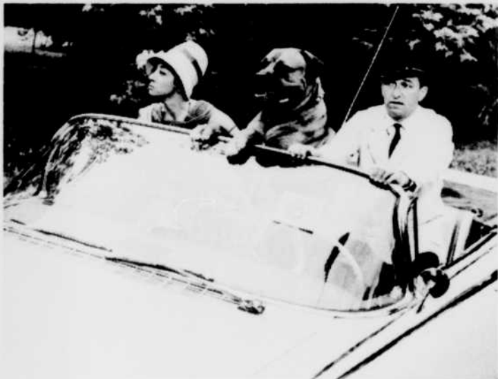
«La Belle Américaine», au «Cinéma du mardi», le 28 à 19 h 30.