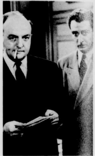
«Les Anciens de Saint-Loup», au «Cinéma» du mercredi 29 à 14 heures.