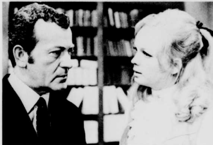
«Les Enquêteurs associés», le mardi à 21 h 30.