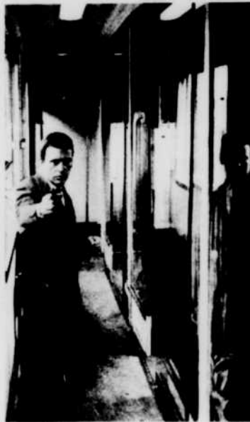
«Trans-Europ-Express», le dimanche 26 à 23 h 30.