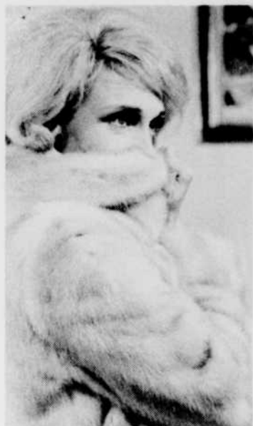
«Les Saintes Chéries», le lundi à 19 h.