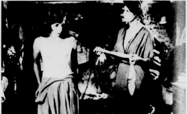
«La Ciociara», à «Ciné-nuit», dans la nuit du samedi 25 au dimanche 26, vers 1 h 15.