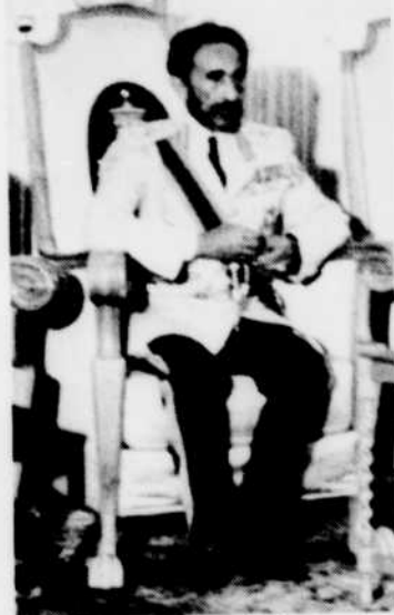
Le Négus, HAÏLÉ SÉLASSIÉ, que nous présentons à 13 h 30 «Les Descendants».