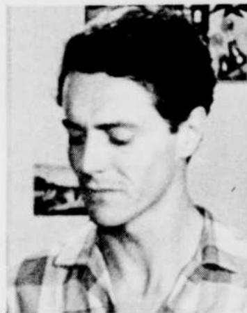
«Chapeau melon et bottes de cuir», le vendredi à 21 heures.