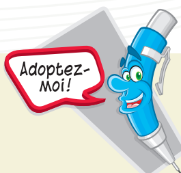
Parmi les activités de sensibilisation réalisées récemment, le Jour de la terre 2014 a été l'occasion pour les employés d'échanger et de récupérer des fournitures de bureau usagées lors d'une activité intitulée « Seconde vie : la récup facile ! », qui a connu un franc succès.