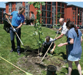
Au printemps 2014, avec le soutien financier de l'organisme Soverdi, une plantation de 80 arbres a eu lieu sur le terrain de l'Institut, à laquelle les employés et les citoyens ont été invités à participer.

Cette reconnaissance a mis en lumière l'ensemble des activités de développement durable déployées par l'Institut et en particulier l'initiative des Jardins communautaires, publicisée sous le thème « Jardiner pour faire tomber les préjugés ». En plus d'offrir un nouveau lieu pour jardiner en ville sur le terrain de l'Institut, le projet vise à démystifier la santé mentale en rapprochant les patients et les citoyens, dans une vision de pleine citoyenneté. Gérés conjointement avec l'arrondissement Mercier-Hochelaga-Maisonneuve, en collaboration avec des organismes communautaires, les jardins ont également pour objectifs la réinsertion sociale et une meilleure accessibilité aux fruits et légumes frais pour les personnes démunies.