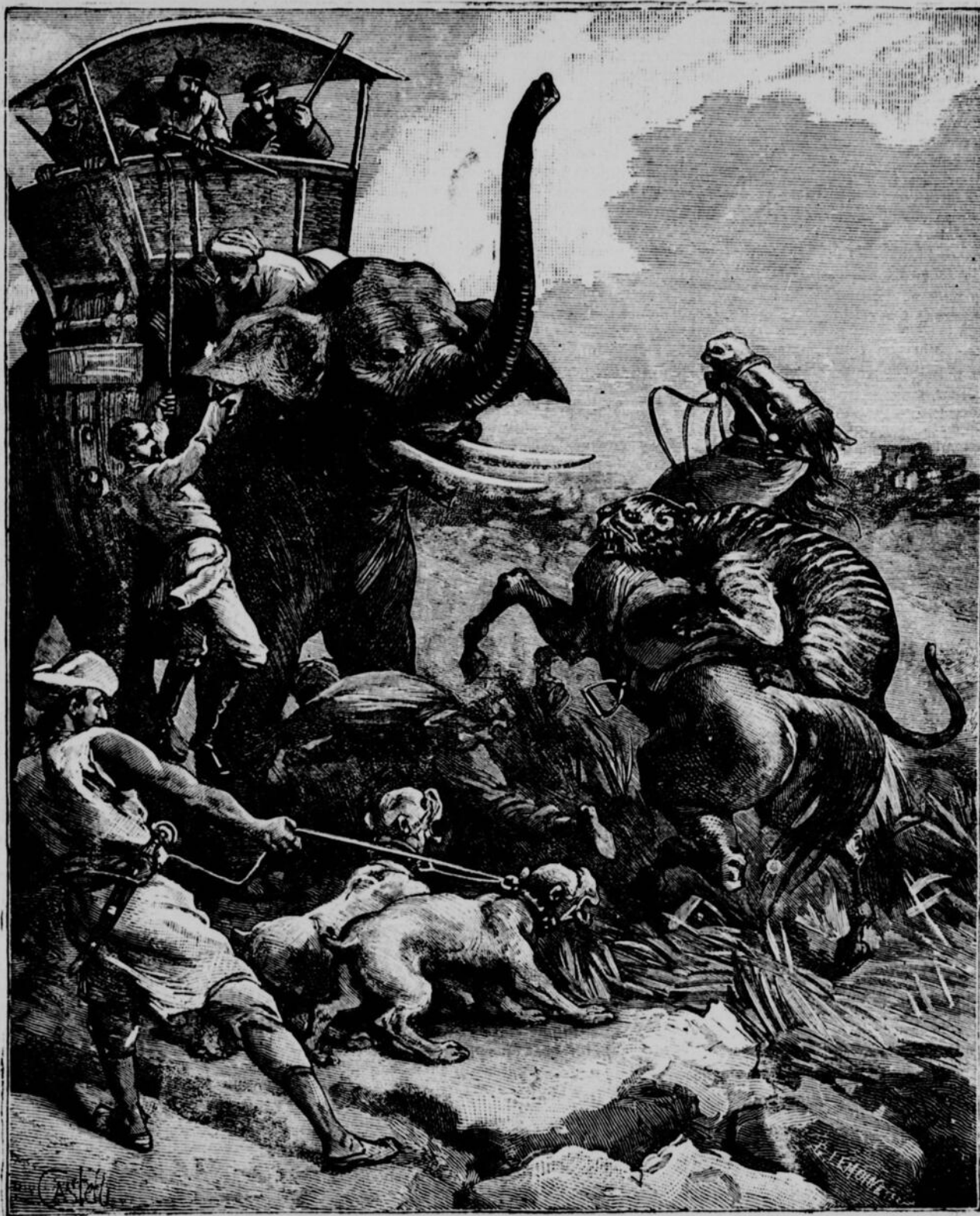
Le tigre venait de tomber sur la croupe de Goldress. — (Voir page 6, col. 3).

Enfin, l'immense majorité des lecteurs prend indistinctement pour "tigres" tous les félins à pelage tacheté. Ceci est encore une erreur. Le tigre est essentiellement rayé de bandes. Il ne se rencontre qu'en Asie. Le jaguar d'Amérique, l'once d'Afrique appartiennent à la famille des panthères et des léopards, et chacune de ces races a son signalement à part. Le tigre, par sa taille, sa force et son courage surpasse de beaucoup ces subalternes de l'espèce féline. Il est au lion d'Afrique ce que le