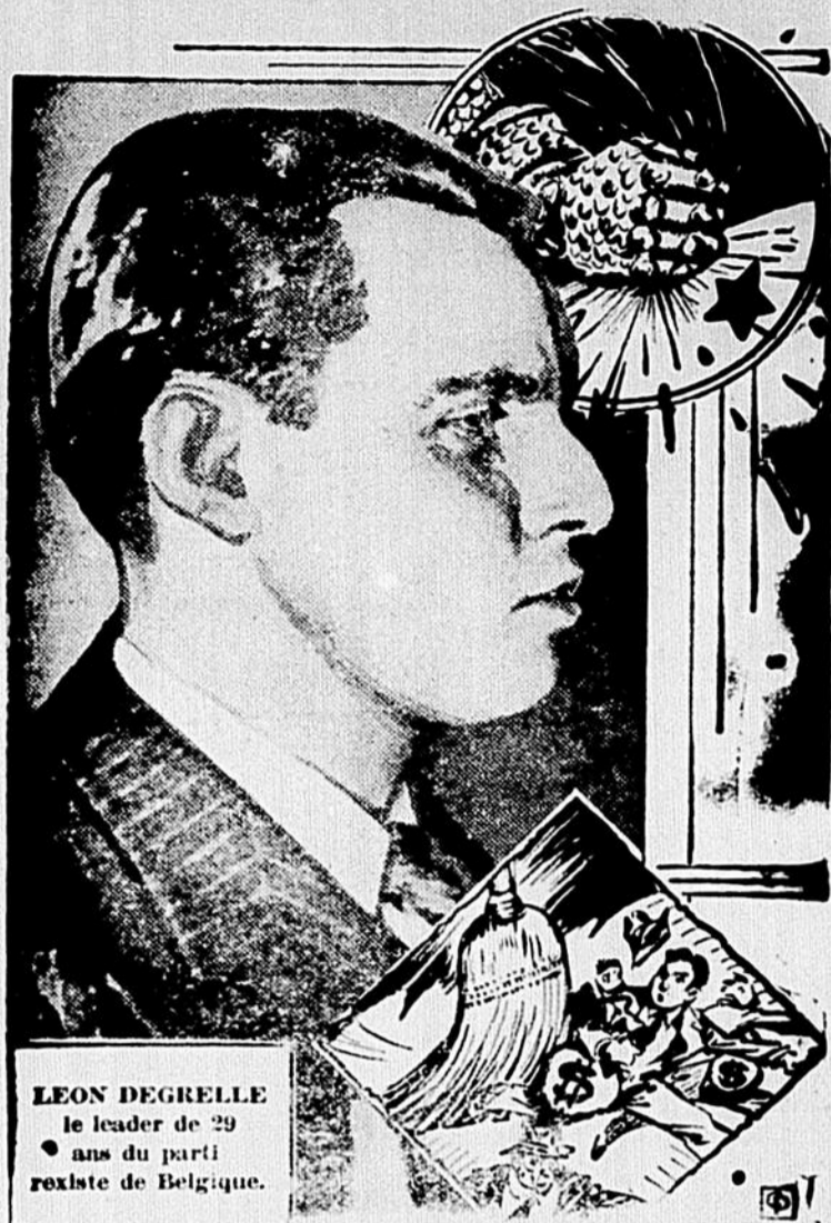
LEON DEGRELLE le leader de 29 ans du parti rexiste de Belgique.