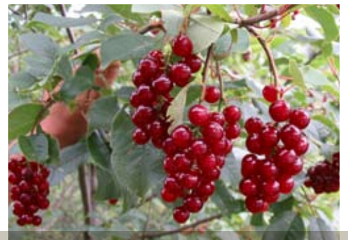
CHAMPIGNONS SAUVAGES, PETITS FRUITS ET AUTRES RNA PEUVENT CONTRIBUER À MOUSSER L'ÉCONOMIE RÉGIONALE.