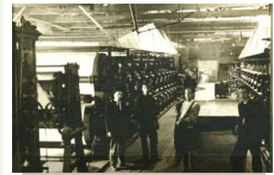
USINE DU GRAND-SAULT.