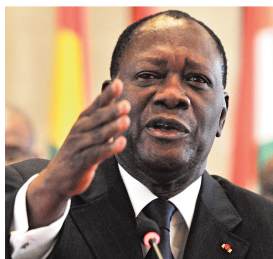
Le président de la Côte d'Ivoire, Alassane Ouattara

Trois ans après l'entrée en fonction du président, les milices qui l'ont porté au pouvoir sont