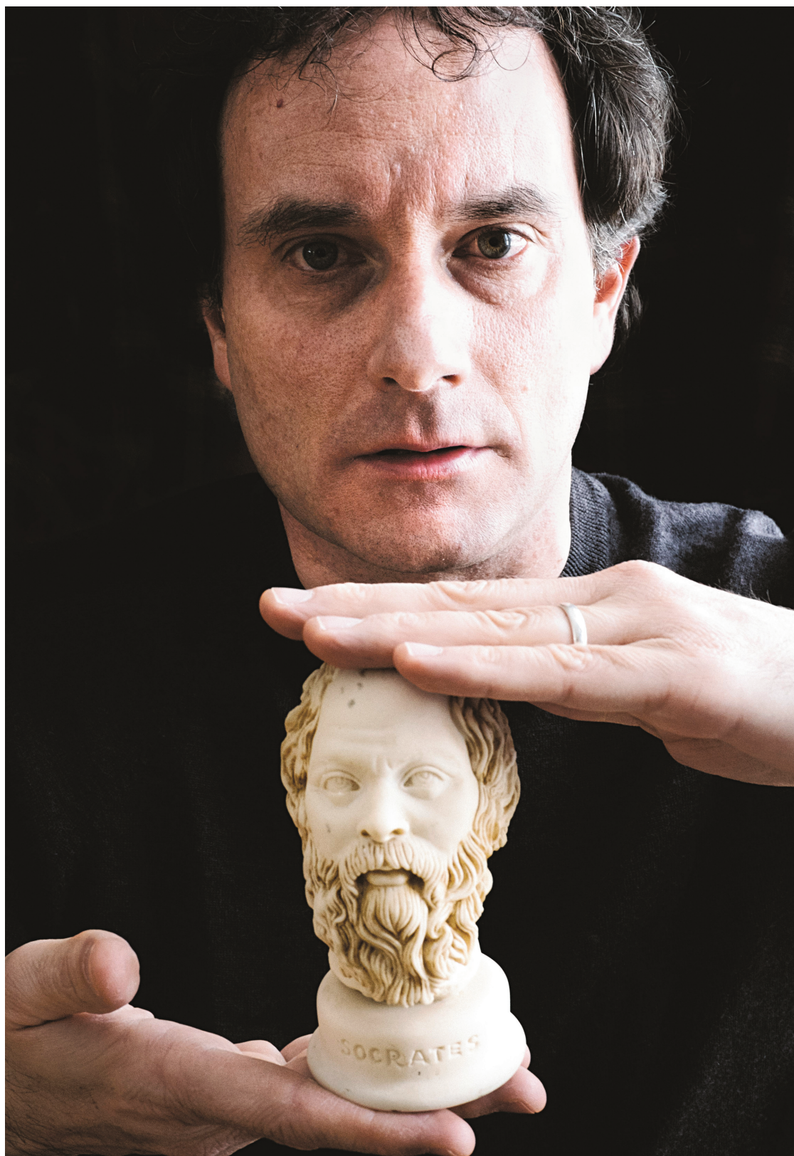
RENAUD PHILIPPE LE DEVOIR

Rien de tout cela avec les sophistes: en quelques semaines, voilà qu'un jeune politicien est formé, prêt à affronter l'assemblée du peuple et à défendre tout et son contraire. Le sophis-