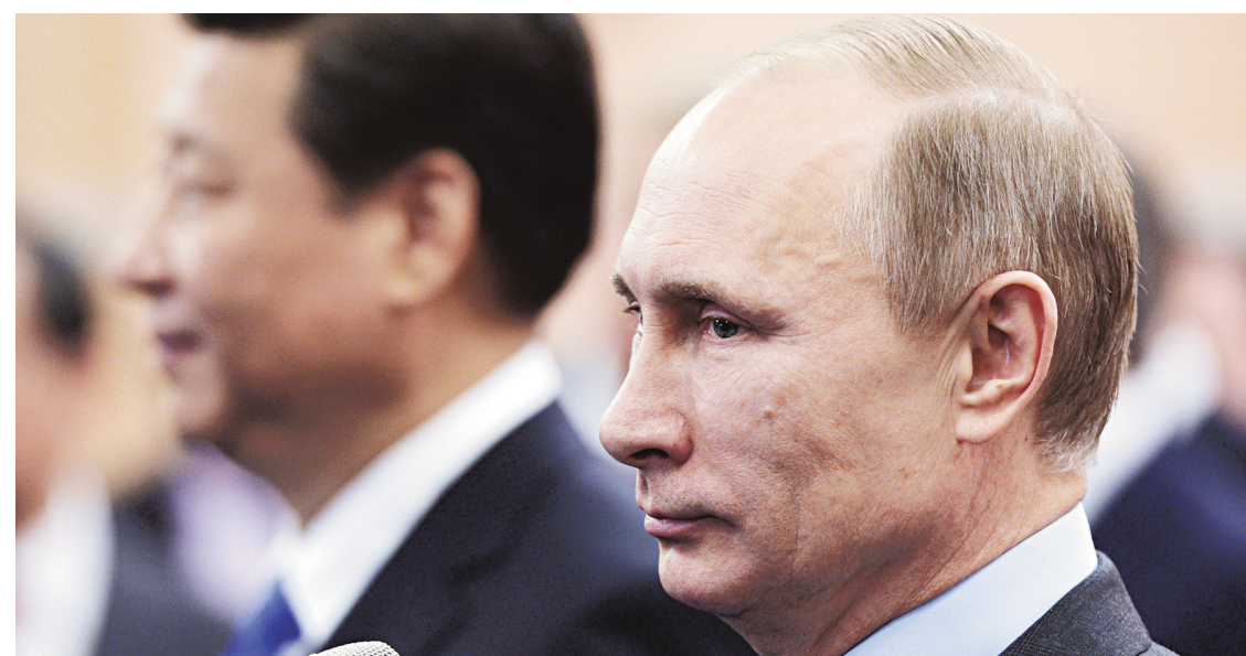
Le président russe, Vladimir Poutine, en compagnie de son homologue chinois, Xi Jinping