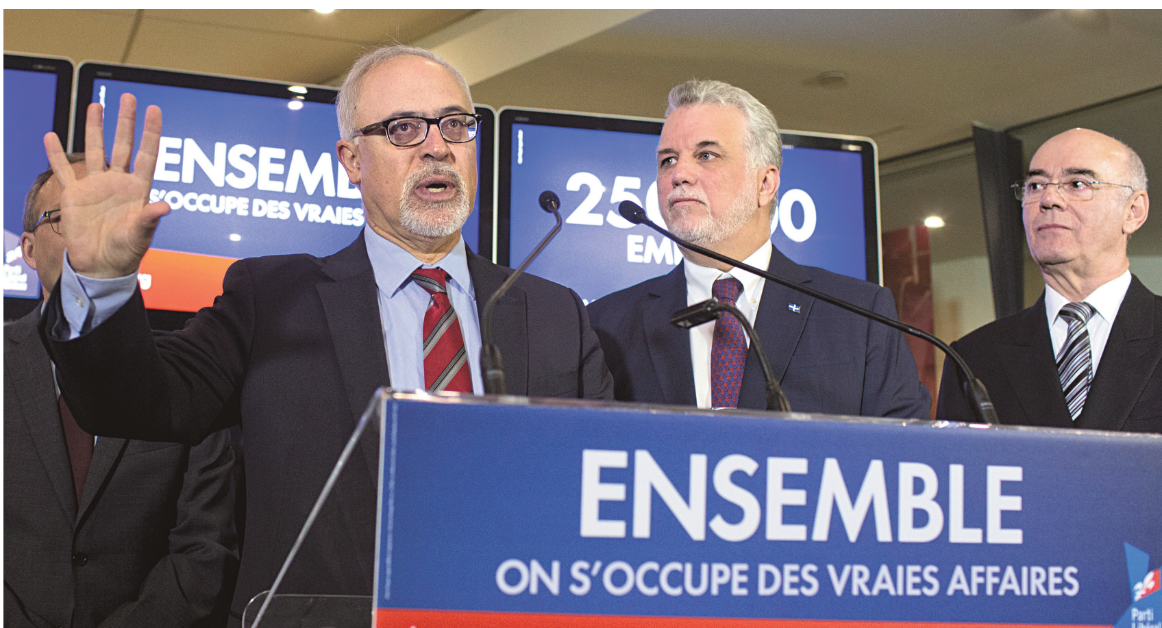
Avec son slogan, le PLQ a voulu montrer qu'il mettait les enjeux économiques au cœur de sa campagne électorale.