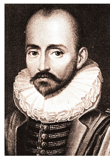
INTERNATIONAL PORTRAIT GALLERY Michel de Montaigne