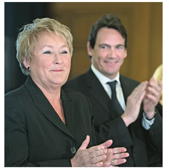
Pauline Marois et Pierre Karl Péladeau