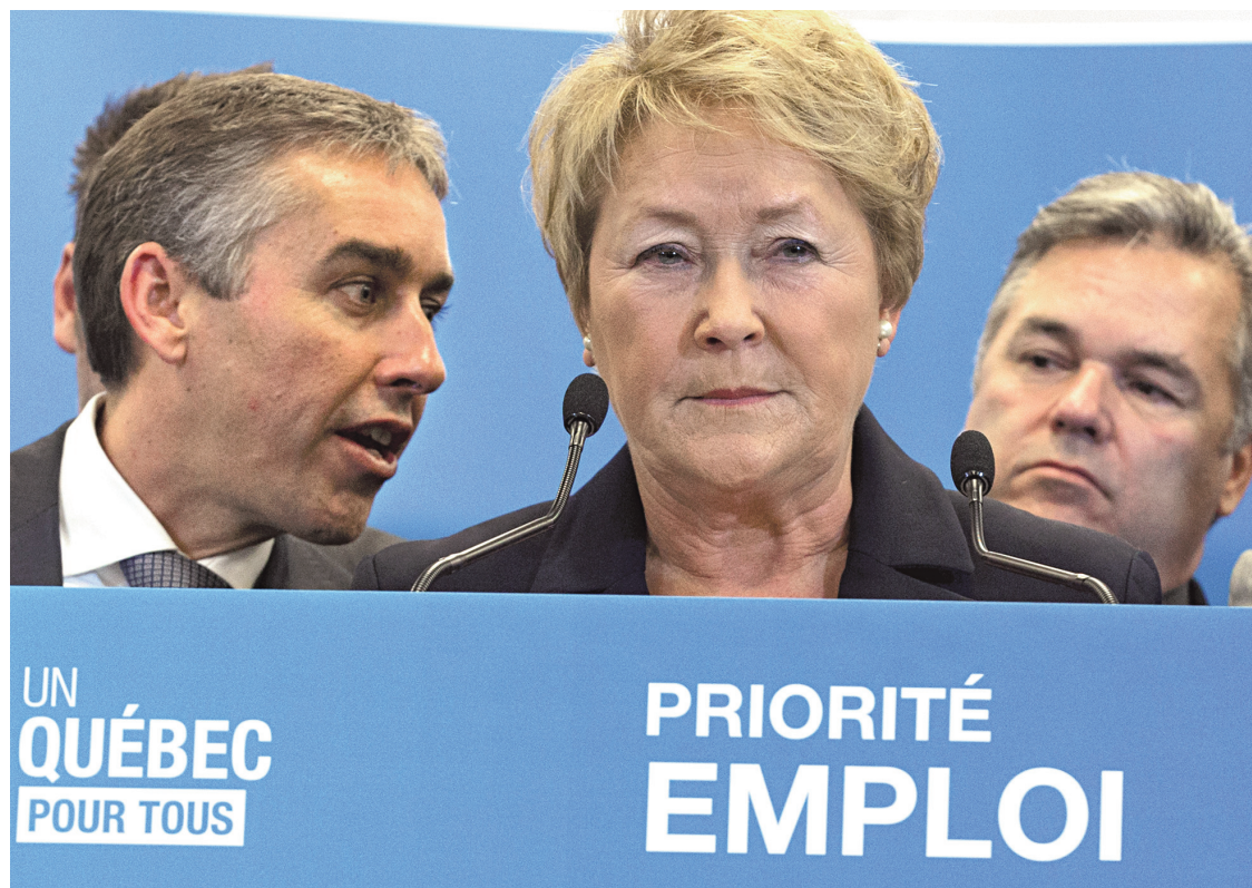
Pauline Marois et Nicolas Marceau (à gauche) lors du lancement du programme de relance économique du gouvernement, le 7 octobre 2013.

Ce qui nous amène à l'un des principaux problèmes auxquels feront face l'économie et les finances publiques du Québec au cours des prochaines années : le vieillissement rapide de sa population. Une étude de la Chaire de recherche en fiscalité et en finances publiques de l'Université de Sherbrooke rappelait, au début de l'année, que ce choc démographique se traduira, d'ici 25 ans, par une forte augmentation (+87 %) des personnes âgées de 65 ans et plus en même temps que par un recul de 4 % de la