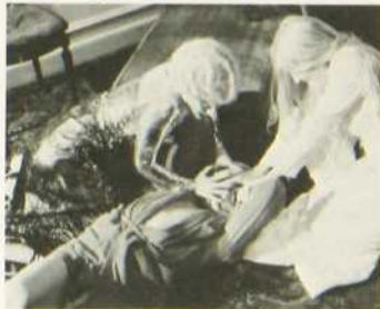
Le Rouge aux lèvres

aussi les deux jeunes gens ne se préoccupent guère des autres clients de l'hôtel avec lesquels ils n'ont que des relations de pure courtoisie. Leur étonnement est donc grand quand une mystérieuse comtesse, accompagnée d'une amie, vient s'installer à l'hôtel et témoigne un intérêt exagéré à leur égard, particulièrement envers la jeune mariée. L'étonnement du couple se changera en horreur quand il apprendra que la pseudo-comtesse est une femme-vampire qui a jeté son dévolu sur la jeune mariée.