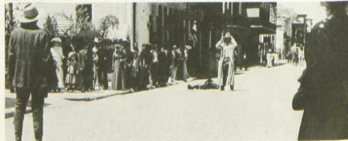
Mon nom est Personne

Plus tard, toujours prisonnier du mythe qu'il incarne, il devra évidemment rencontrer son jeune disciple en combat singulier.