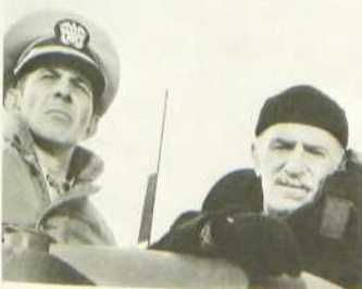
Alerte sur le Wayne