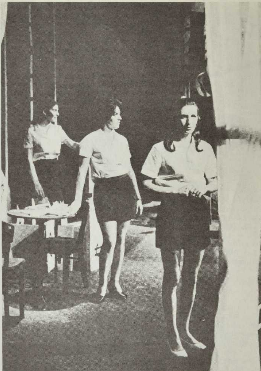
Les Treize Université Laval En pièces détachées

La troupe compte maintenant plus de cinquante (50) membres; les répétitions ont lieu deux fois par semaine soit les lundis et mercredis de 19 à 22 heures à l'école Élémentaire Notre-Dame-de-la-Paix située aux angles des rues Caisse