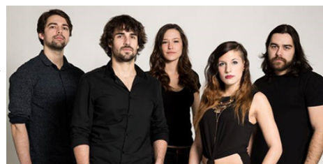
BEAT TRIP (spectacle samedi soir)