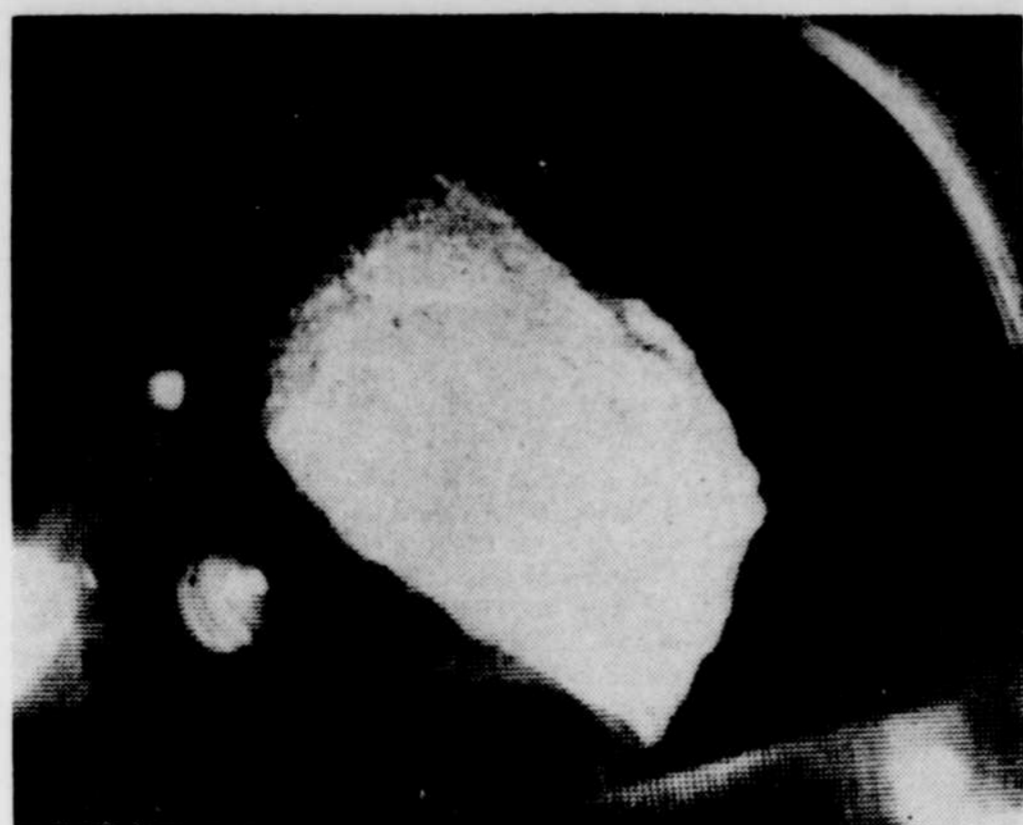
LES SAVANTS DU LABORATOIRE DE RECEPTION lunaire de Houston ont commencé à analyser les échantillons de lune au microscope. La photo nous fait voir une des premières roches qui a fait

Le système de taxe volontaire de Montréal a été jugé comme étant une loterie, donc comme étant illégal, par la Cour d'appel du Québec, mais la Ville de Montréal a décidé de porter cette cause devant la Cour suprême du Canada, où elle doit être entendue cet automne.