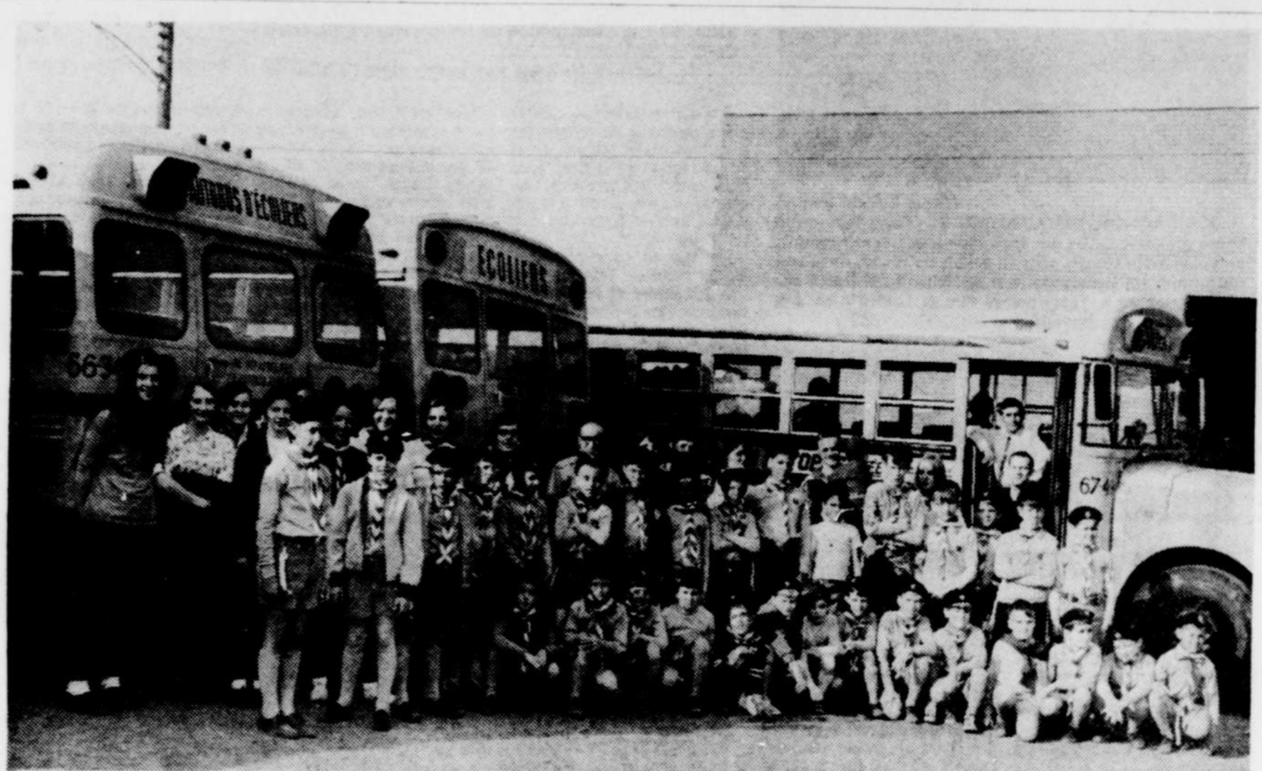
LES LOUVETEAUX de la meute de Saint-Jean-Bosco de Tracy ont participé à un camp scout à Saint-Michel des Saints. Pour la plupart d'entre eux, il s'agissait de leur premier camp, qui a été un succès. Les jeunes ont voyagé par autobus, sous la direction des chefs scouts.

leurs, il s'était trouvé un groupe d'hommes convaincus de la nécessité de régionaliser les capitaux et de les faire servir à l'amélioration de l'économie du milieu. Cette année, les 30 caisses-membres de la Fédération ont payé un intérêt sur le capital variant de 10 pour cent à 12 pour cent. "Comme quoi, a déclaré monsieur Gagnon, ce peut être payant de faire confiance à nos institutions". Comme quoi également, l'entraide économique est une réponse aux besoins nouveaux d'une société économique qui, à sa manière fait aussi l'objet d'une contestation.