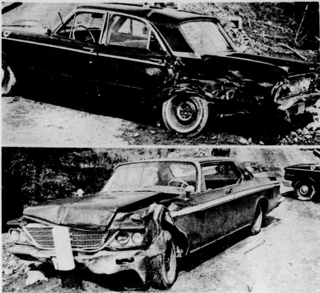
UN ACCIDENT DE LA ROUTE EST SURVENU samedi après-midi vers 15.00 heures dans le rang Saint-Guillaume à environ 2 milles de la route 48 à Saint-Paul de