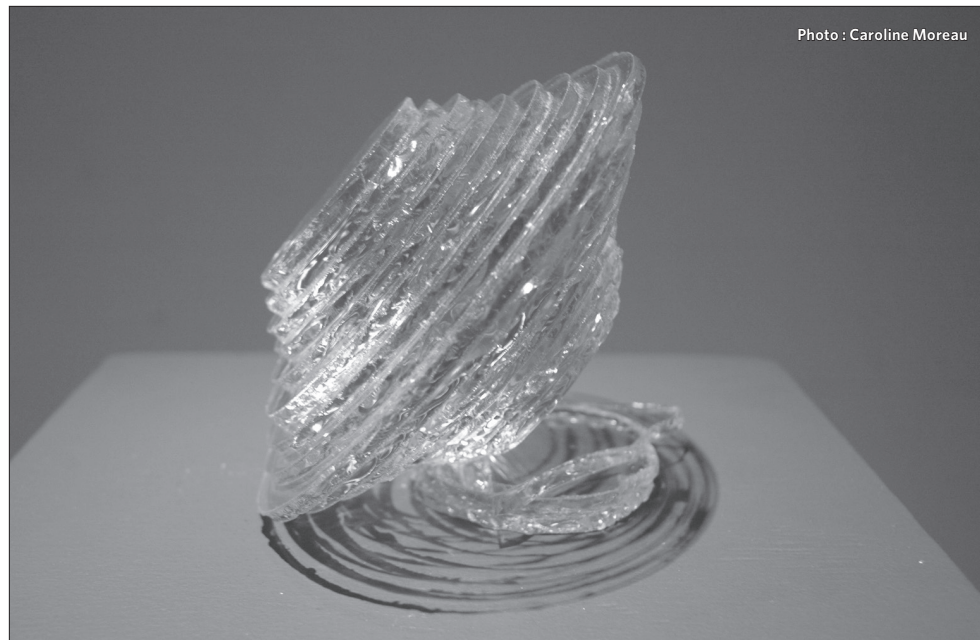
Une des oeuvres qui seront présentées.