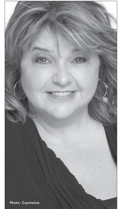
L'humoriste Lise Dion avec son spectacle Le temps qui court .

scénique de l'année, Spectacle d'humour de l'année et Humoriste de l'année) est à la hauteur des attentes. Ses textes sont de qualité, la mise en scène est bonne et Lise Dion se donne à 100% dans chacun de ses numéros. Elle a d'ailleurs salué, lors de son spectacle du jeudi, l'humoriste François Massicotte qui collabore à ses textes.