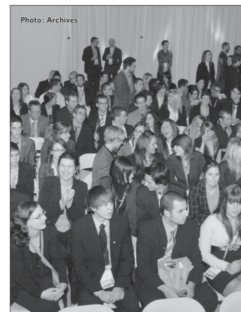
Place à la Relève 2010.

En terminant, il faut mentionner que le comité organisateur recherche présentement des bénévoles qui contribueront au succès de cet événement. Si vous voulez prendre part à Place à la Relève 2011, visitez le www.releveengestion.ca . (G.R.)