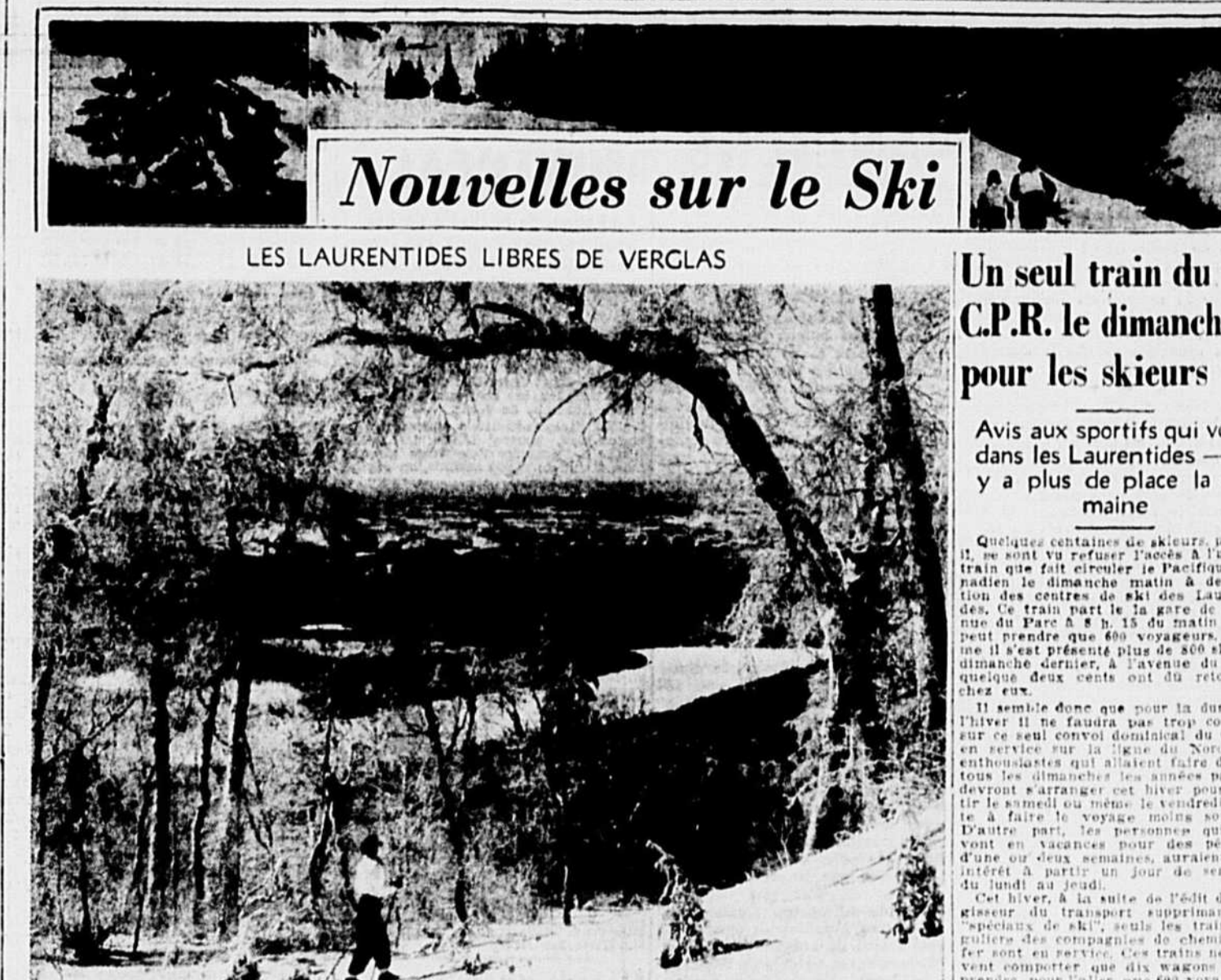
LES LAURENTIDES LIBRES DE VERGLAS. Les Laurentides, surtout dans les parties les plus élevées de Ste-Adèle, Val Morin et Ste-Agathe, ont échappé à la pluie et au verglas que nous avons eus dans la région métropolitaine cette semaine. On peut s'attendre à une nouvelle ruée vers les champs de neige laurentides samedi et dimanche. Nul doute que les nombreux skieurs iront admirer ces magnifiques paysages semblables à celui que nous voyons ci-dessus et qu'ils emprunteront la piste de la feuille d'Erable pour un long "cross country".