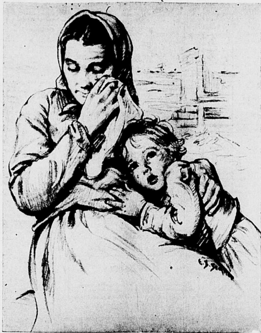
Ces milliers de mamans russes, comme celle qu'illustre ce remarquable fusain, sont plongées aujourd'hui dans la plus profonde douleur. Leurs enfants demandent à manger; se blottissent contre elles pour se protéger du froid, qui sévit plus encore qu'au Canada; ont grand besoin de médicaments. Il est facile aux pères et mères du Canada de se porter au secours de ces innocentes victimes de notre ennemi commun en souscrivant au Fonds canadien de l'Aide à la Russie, soit par l'entremise d'un comité local, soit à la chambre 679, édifice Sun Life, Montréal.

est devenu en un rien de temps un fanatique de la vie au grand air. Il m'a dit: "Nous n'avons qu'une chopine d'eau par jour pour nous laver, nous raser et laver notre linge. Nous ne prenons donc pas de bains très souvent. Il est possible que nous sentions pas très bon mais quand on sent tous pareils on n'y voit que du feu. Et ça fait tant de bien de vivre comme nous vivons!"