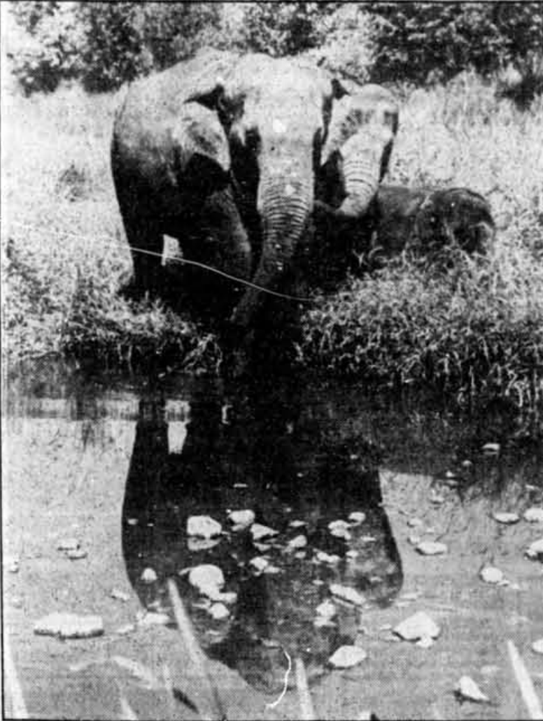
Dans l'écologie de la jungle, l'éléphant d'Asie joue un rôle irremplaçable dont dépend la survie de nombreuses autres espèces.

Les scientifiques ont calculé qu'en 24 heures, un petit troupeau de dix éléphants peut déposer plus d'une tonne d'excréments sur le sol de la forêt. Les papillons et les coléoptères se nourrissent sur ces amas, les oiseaux y trouvent des graines, des spores de champignons s'y développent. Les termites décomposent la cellulose non digérée qui forme une bonne