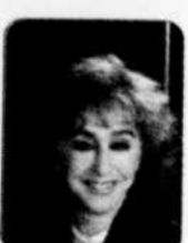
MICHELINE DE GRÈCE