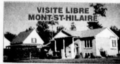
VISITE LIBRE MONT-ST-HILAIRE

1- 767, Chopin: Tout brique, 4 cac, secteur paisible. ARMAND LANDRY JOHNNY PIACENTE 446-8600