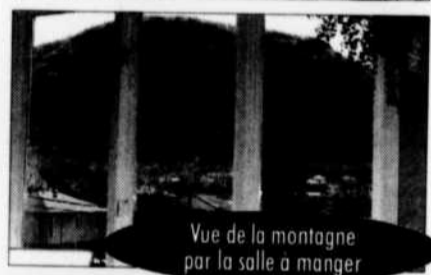
Vue de la montagne par la salle à manger