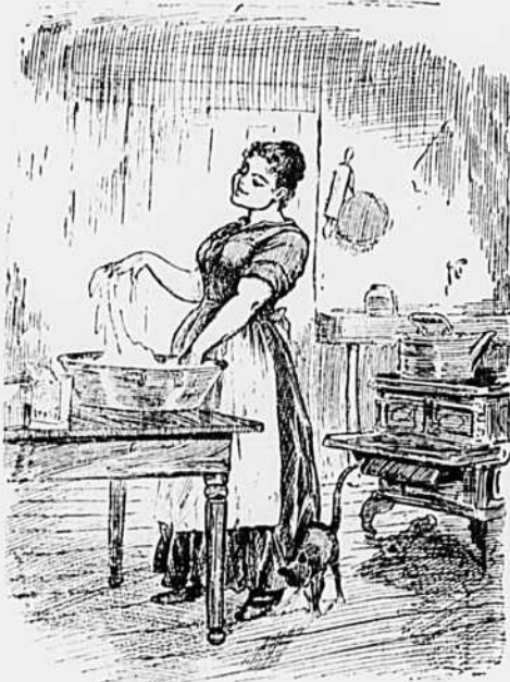
I Jeunemariée.—L'épicier m'a dit que ce levain ferait lever les morts...