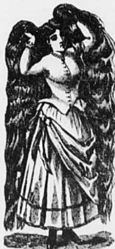
Marque de Commerce.

Pourquoi permettre à vos cheveux gris de vous vieillir prématurément quand, par un usage judicieux du RESTAURATEUR DE ROBSON, vous pouvez facilement rendre à votre chevelure sa couleur naturelle et faire disparaître ces signes d'une décadence précoce?