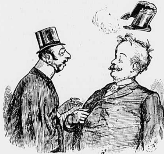
Singulier effet produit sur le chapeau de monsieur Croisenui, en apprenant de Tire Lacarotte qu'il passe pour le plus grand orateur de Montreal.

Quelle épreuve ! Aussi M. et madame Dubercail frissonnaient-ils d'avance, prêts, peut-être, à crier aux Parisiens ou autres qui oseraient se présenter :