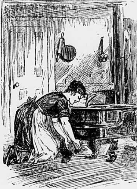
II —Je crois qu'en le mettant sous le poêle, il aura une bonne avance pour demain.