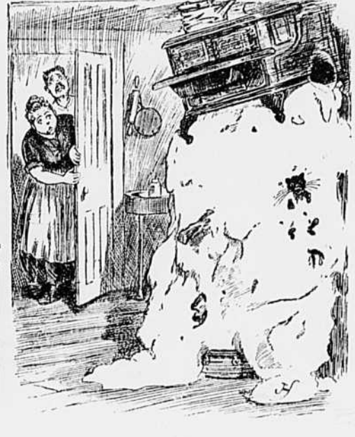
III Le lendemain matin.