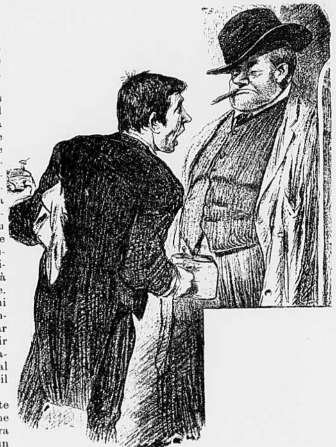
M. Cuirasoulier.—Garçon, je veux manger.

Frottant de ses mains gourdes ses yeux ensommeillés, Louisic Guinvarch', fusilier à la quatrième du second, éprouve