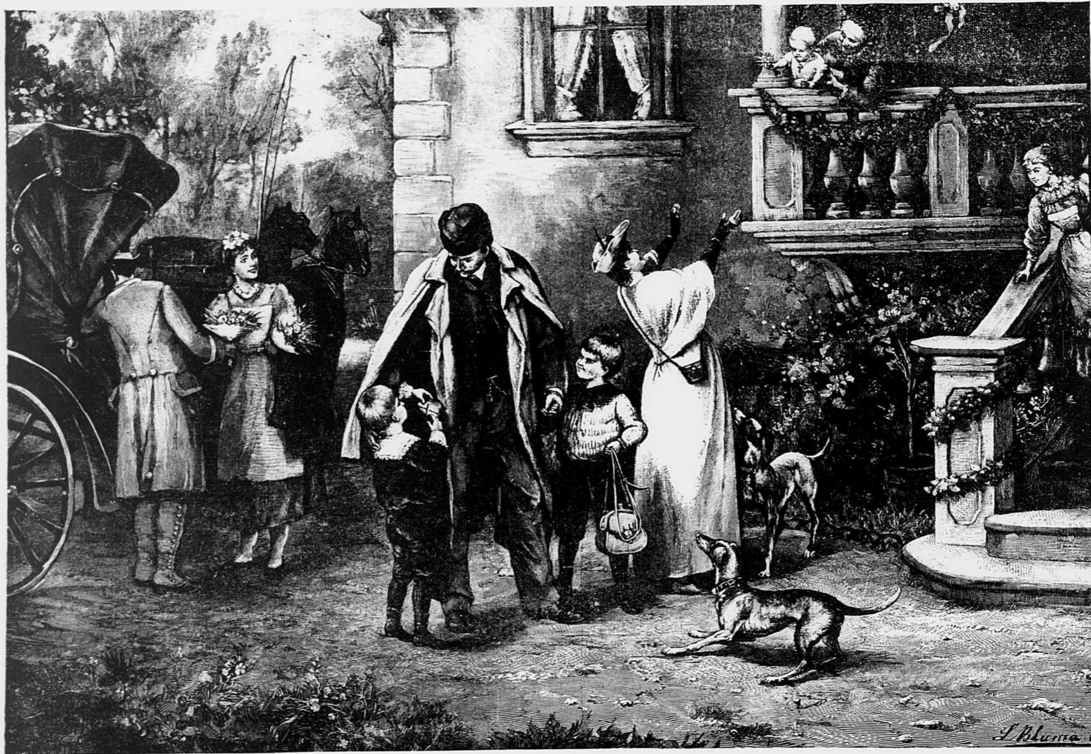
APRES TROIS MOIS D'ABSENCE.