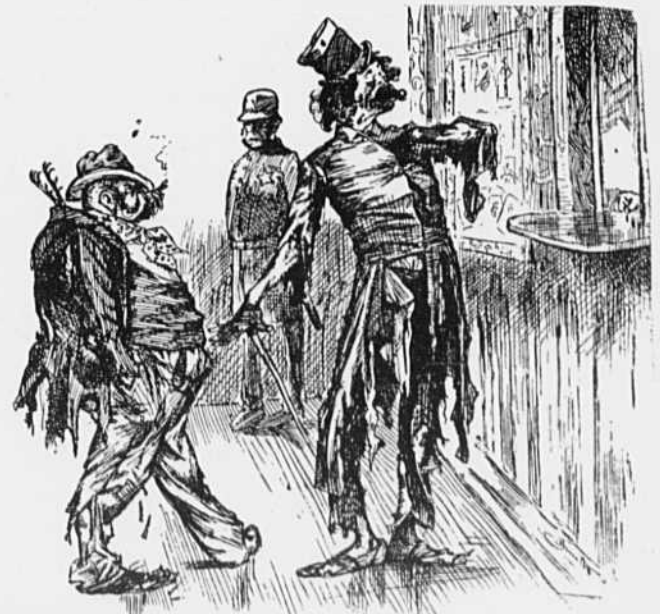
(A l'entrée du théâtre.)