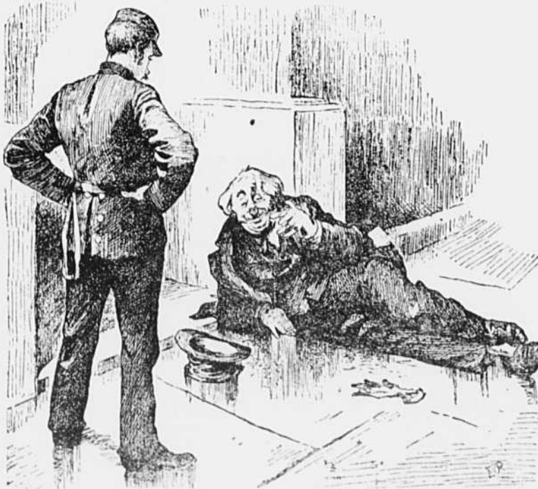
Sergeant de police.—Allons, debout ; ou je vous mène au poste. Le père Louison.—Tendez, un peu que j'phrenne des notes. Shuis allé au musée. J'ai vu un moineau blanc, un sherin rouge, un chat couleur de flanelle, trois sherpents écarlates, dix-huit rats jhaunes et un petit cheval vbert.

À la sensation pénible du froid qui, tout à l'heure, lui arrachait des larmes, a succédé une souffrance bien autrement cruelle : l'horrible appréhension de sa fin prochaine ; sans cesse, à ses oreilles, tinte la lugubre prophétie de la pauvre femme : "Courage, Louisic, tu n'as plus longtemps à souffrir."