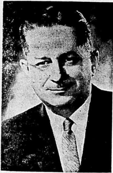
JEAN LESAGE) et (DANIEL JOHNSON)

A Shawinigan, le Premier Ministre Jean Lesage a déclaré dimanche que son gouvernement a décidé de nationaliser 11 compagnies d'électricité pour des raisons commerciales et non pas pour des raisons de "race". "Si ces 11 compagnies étaient administrées par des canadiens-français, a-t-il dit, il serait encore de notre devoir de nous présenter devant vous pour en proposer la nationalisation".