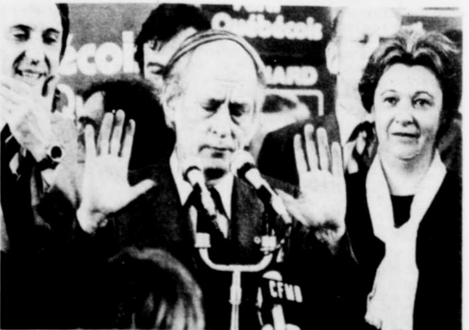
René Lévesque tente de calmer les supporters du PQ, après l'annonce de l'élection du PQ, le 15 novembre 1976.

"Il s'agit d'une manoeuvre déguisée qui vise à faire croire aux Québécois que leur gouvernement va tirer davantage d'argent en 82-83 mais sans dire aux Québécois cependant, que pour faire ça, il faut qu'ils abolissent tout le système de perception fiscale qui a été une sorte de garantie de