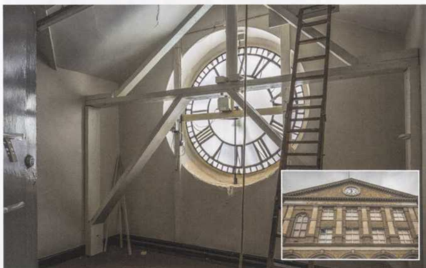
Behind The Clock.